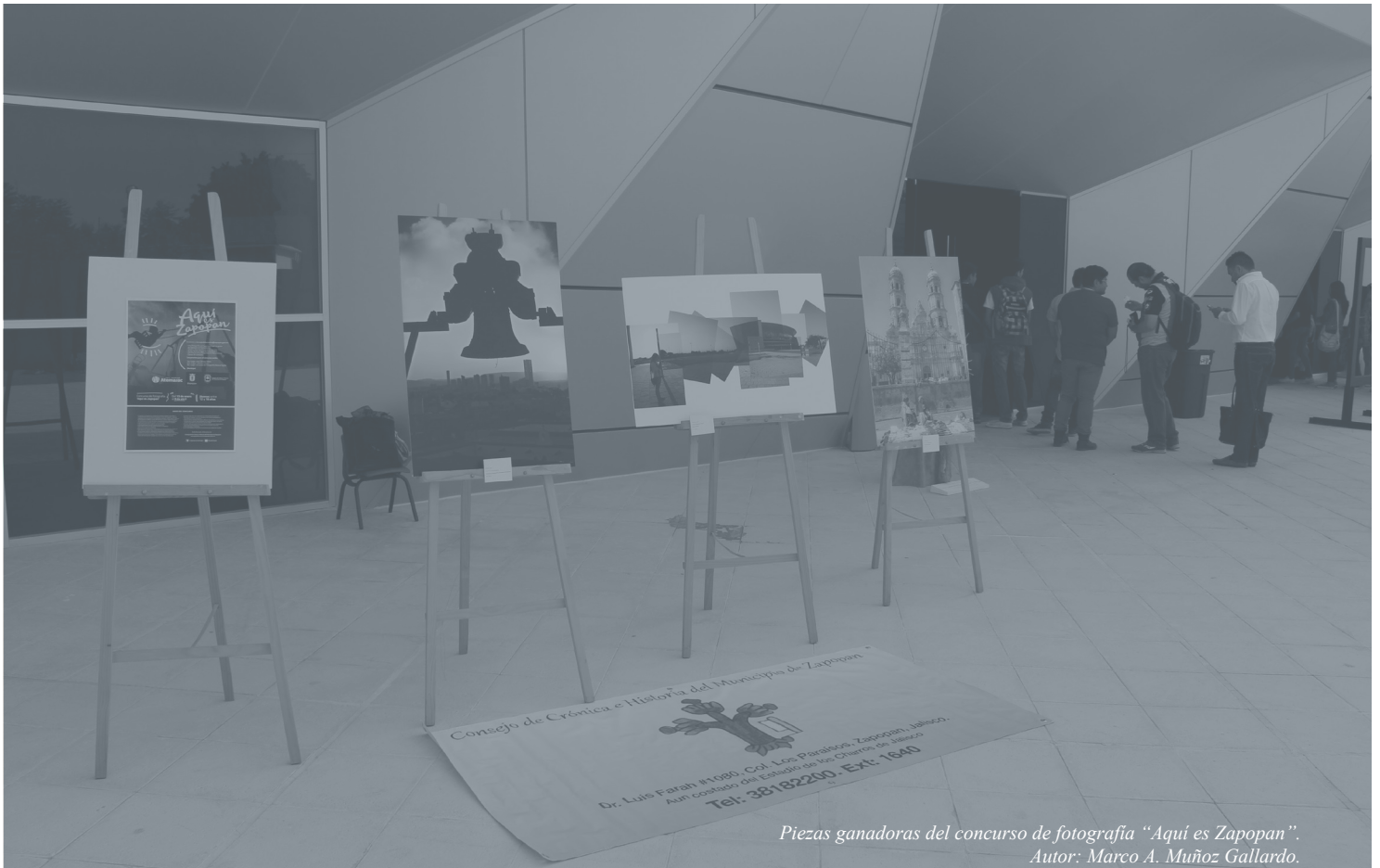
Piezas ganadoras del concurso de fotografía "Aquí es Zapopan". Autor: Marco A. Muñoz Gallardo.