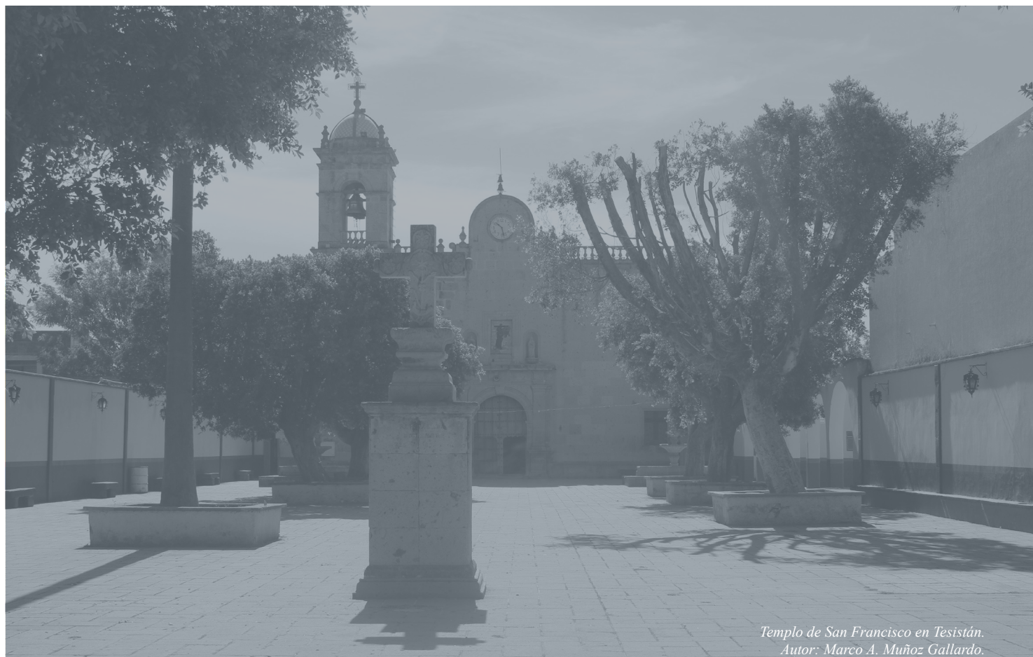
Templo de San Francisco en Tezistán. Autor: Marco A. Muñoz Gallardo.