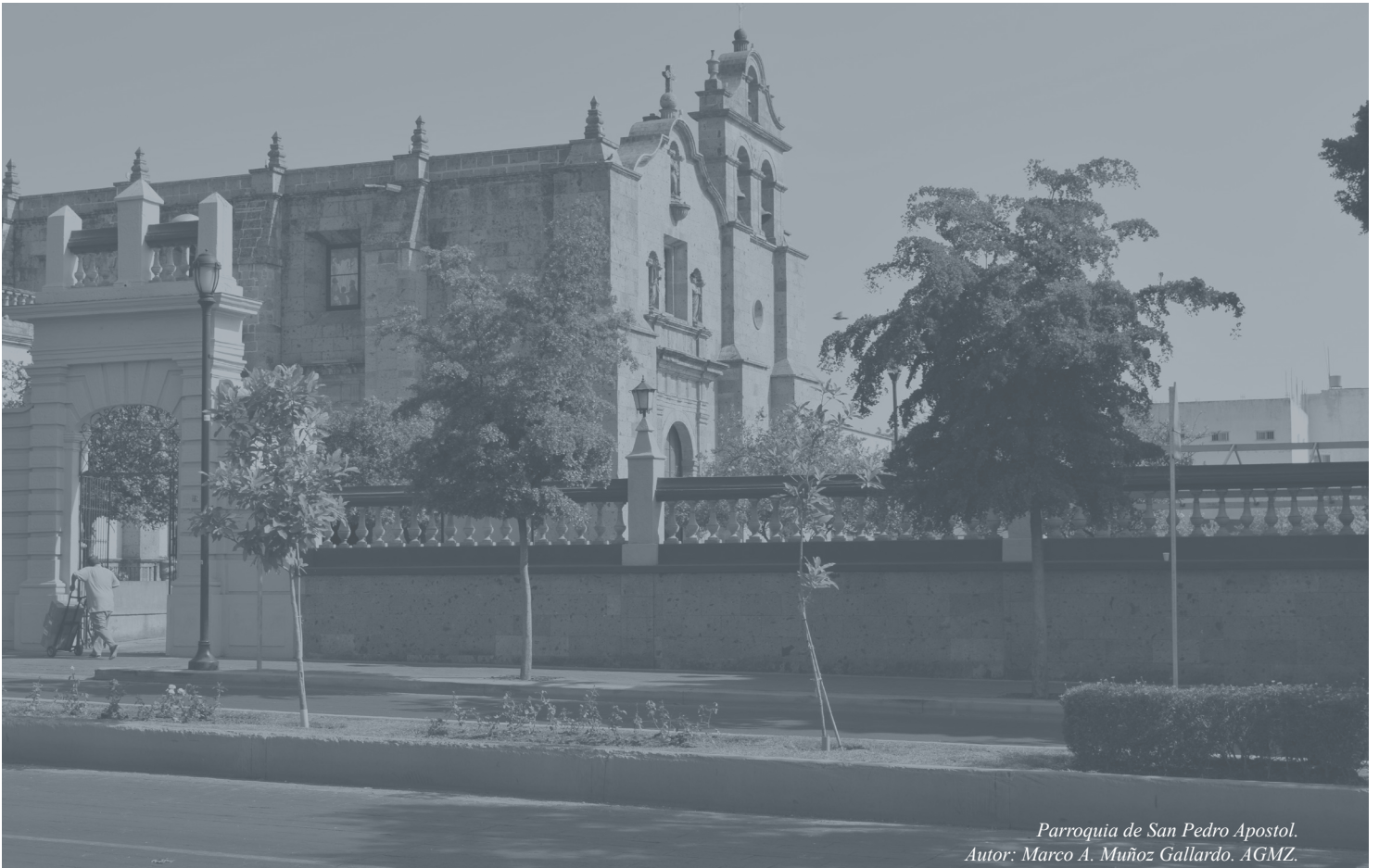
Parroquia de San Pedro Apostol.

PRESUPUESTO DE EGRESOS PARA EL EJERCICIO FISCAL 2016, EN EL MUNICIPIO DE ZAPOPAN, JALISCO.