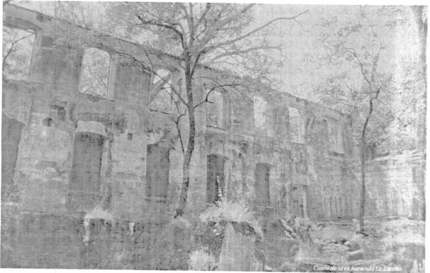
Casco de la ex hacienda La Escoba.