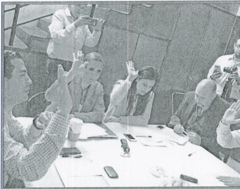
Ilustración 9.- Sesión Ordinaria Conjunta de las Comisiones Colegiadas y Permanentes de Hacienda, Patrimonio y Presupuestos y de Reglamentos y Puntos Constitucionales

Por otro lado, en esta Comisión aprobamos el Reglamento de Transparencia y de Información Pública de Zapopan, con la finalidad de que se garantice de forma más factible, comprensible e incluyente el acceso a la información y la protección de los datos personales de los ciudadanos.