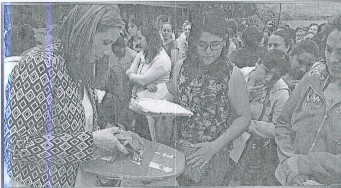
Ilustración 5.- Entrega de paquetes escolares del Programa "Zapopan Presente"

Este programa ha sido diseñado con el fin de brindar herramientas a favor de la equidad educativa, del mejoramiento de la calidad de vida de las familias zapopanas y de los alumnos que estudian en sus escuelas. Tiene el objetivo de apoyar la economía familiar mediante paquetes escolares (mochilas, útiles, uniformes y calzado) para que nuestros niños y jóvenes que estudian la educación básica y especial, cuenten con todo lo necesario que les permitan su desarrollo educativo integral. Cabe resaltar que este programa social también beneficia a los comercios de Zapopan, ya que los padres de familia canjean los vales para los útiles escolares de sus hijos, en las pequeñas papelerías del municipio.