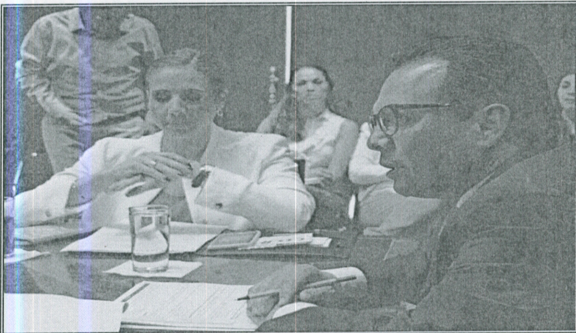
Ilustración 7.- Sesión Ordinaria Conjunta de las Comisiones Colegiadas y Permanentes de Gobernación y Asuntos Metropolitanos y de Desarrollo Urbano en la aprobación del POTMET.

Al interior del seno de la Comisión Colegiada y Permanente de Desarrollo Urbano, así como de la Comisión Colegiada y Permanente de Gobernación y Asuntos Metropolitanos, participamos en la aprobación del Plan de Ordenamiento Territorial Metropolitano (POTMET); logro en materia de administración territorial porque marca la pauta para el desarrollo poblacional ecológico, económico y sustentable para los nueve municipios que integran el Área Metropolitana de Guadalajara. Señalo este gran avance, puesto que después de más de treinta años se logró el consenso para que estos ayuntamientos coordinen sus trabajos eficientemente y se consolide una verdadera gestión intermunicipal del fenómeno metropolitano. El modelo del POTMET mejorará la distribución de los recursos y de las oportunidades, y contribuirá al fortalecimiento de un mejor vivir para las y los ciudadanos.