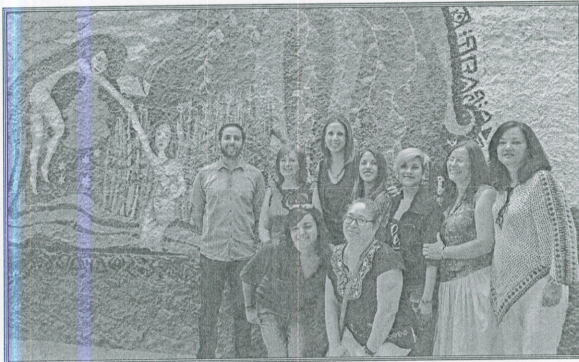
Ilustración 6.- Inauguración del mural realizado en las inmediaciones de la Unidad Deportiva Lomas de Zapopan.