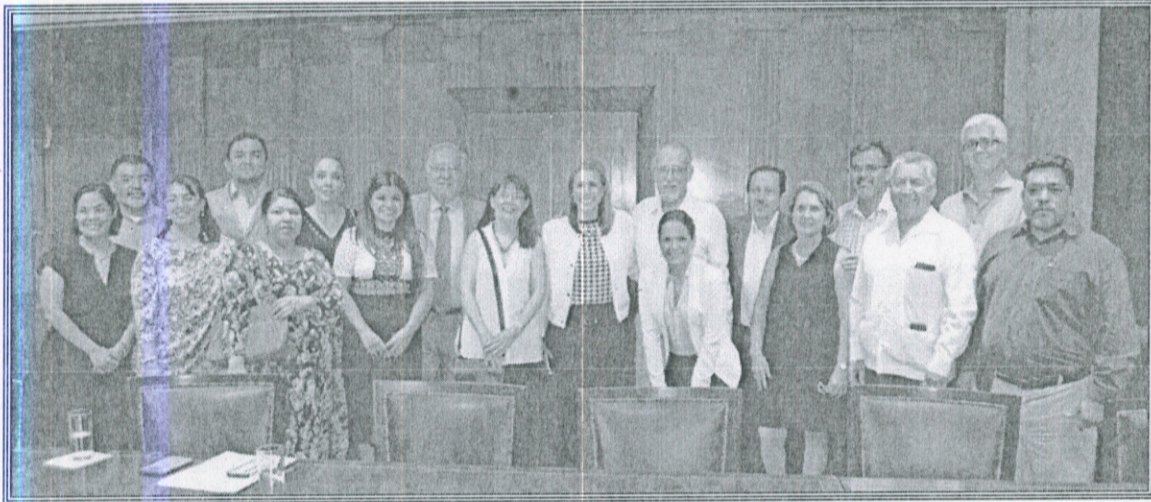
Ilustración 8.- Toma de protesta del Consejo de Participación Ciudadana.

En el seno de esta Comisión también participamos en la resolución de asuntos de suma importancia para fortalecer los vínculos del gobierno municipal con los ciudadanos. A continuación se señalan las sesiones ordinarias a las que he asistido (ver tabla 6).