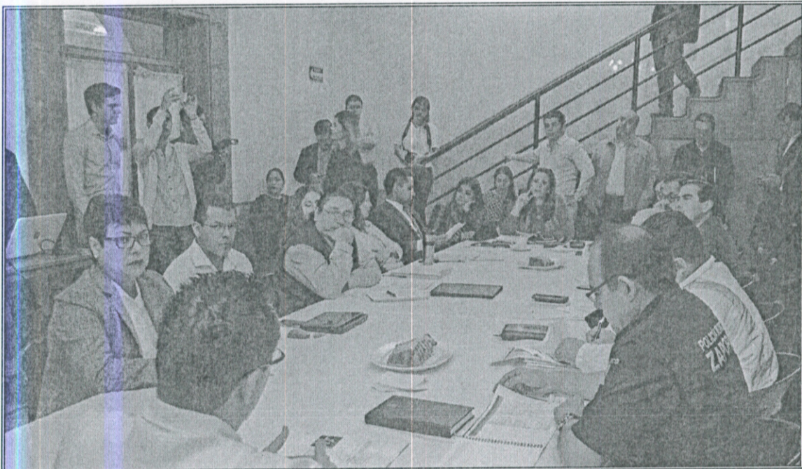
Ilustración 3.- Mesa de trabajo de la Comisión Colegiada y Permanente de la Comisión de Hacienda, Patrimonio y Presupuestos con diversas dependencias municipales

De la misma forma, en la construcción del dictamen del Presupuesto de Egresos Municipal, la Comisión convocó a mesas de trabajo en las que participaron diversas dependencias municipales con la finalidad de que expusieran sus requerimientos de recursos financieros, económicos, humanos y materiales para poner en marcha los programas y los proyectos que permitan dar resultados para la ciudadanía.