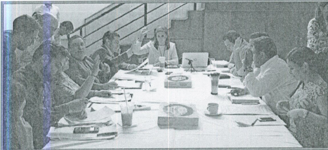
Ilustración 2.- Sesión Ordinaria de la Comisión de Hacienda, Patrimonio y Presupuestos en la cual se aprobaron diferentes convenios de colaboración en beneficio de los ciudadanos.

De la misma forma, se aprobaron dictámenes en los que se autorizan las celebraciones de contratos de comodatos con instituciones educativas de carácter público, con la finalidad de regularizar las posesiones de los predios en los que se encuentran las mismas, ubicadas en diferentes localidades del municipio de Zapopan.