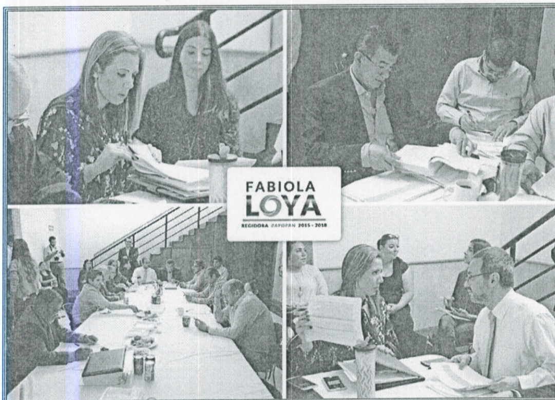
Ilustración 10.- Sesión de la Comisión de Asignación de Obra Pública

En el seno de la Comisión de Asignación de Obra Pública hemos estado trabajando en la generación de obras públicas que otorguen el mayor de los beneficios a todos los habitantes del municipio de Zapopan.