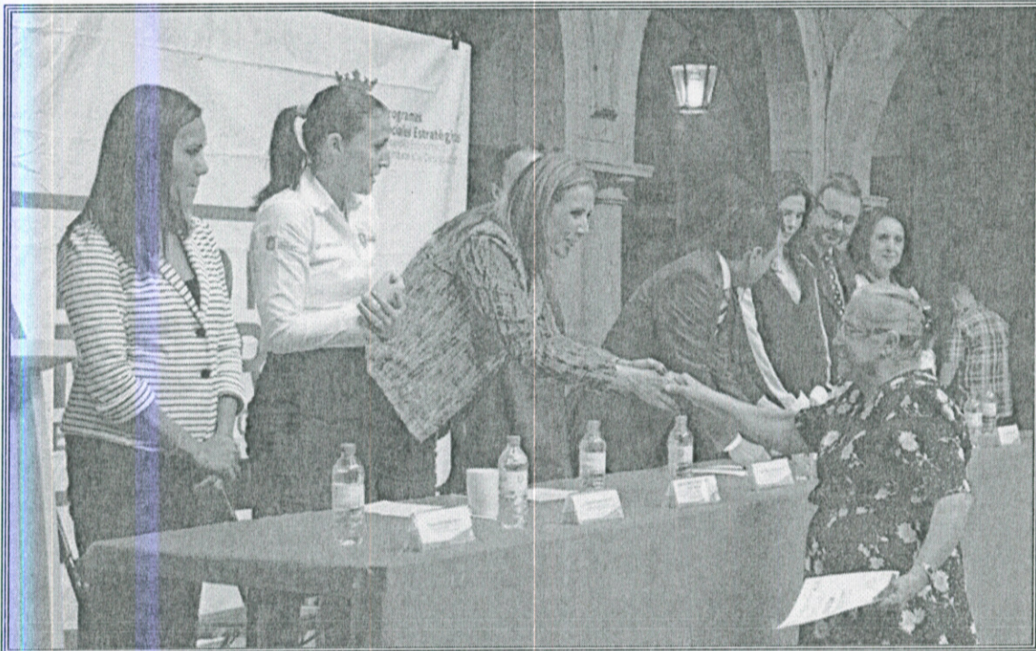
Ilustración 4.- Entrega de reconocimientos a las mujeres que participaron en los talleres de emprendurismo dentro del marco del Programa “Hecho por Mujeres de Zapopan” el pasado 22 de agosto 2016.

El programa “Hecho por Mujeres de Zapopan” comprende una serie de acciones para que mujeres de que viven en zonas de muy alta, alta y media marginación cuenten con oportunidades que les permitan auto emplearse, iniciar un grupo de trabajo productivo o mejorar las condiciones de su microempresa o proyecto. Además se brindan cursos de capacitación en temas financieros, plan de negocios, comercialización y seguimiento para lograr proyectos sostenibles, autogestivos y exitosos.