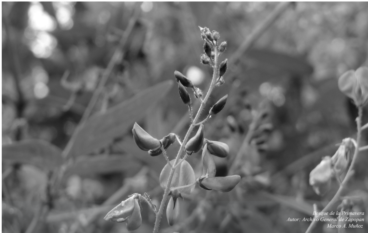
Bosque de la Primavera

REGLAS DE OPERACIÓN DEL PROGRAMA SOCIAL "ZAPOPAN POR ELLAS" PARA EL EJERCICIO FISCAL 2017.