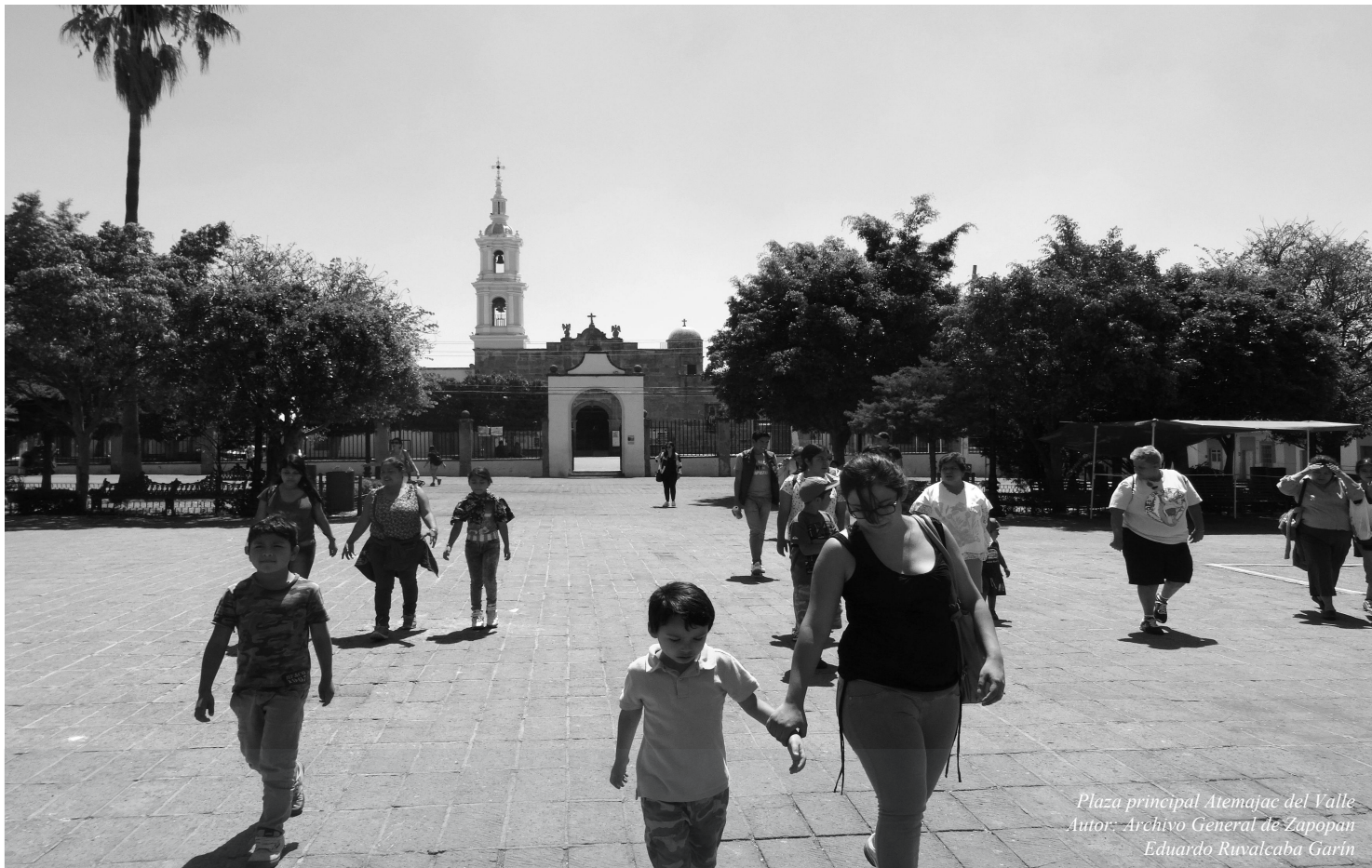
Plaza principal Atemajac del Valle

CONVOCATORIA PÚBLICA Y ABIERTA PARA ESTANCIAS INFANTILES PRIVADAS Y DE SEDESOL, PARA QUE PARTICIPEN EN EL PROGRAMA DE BECAS SONRÍE ZAPOPAN.