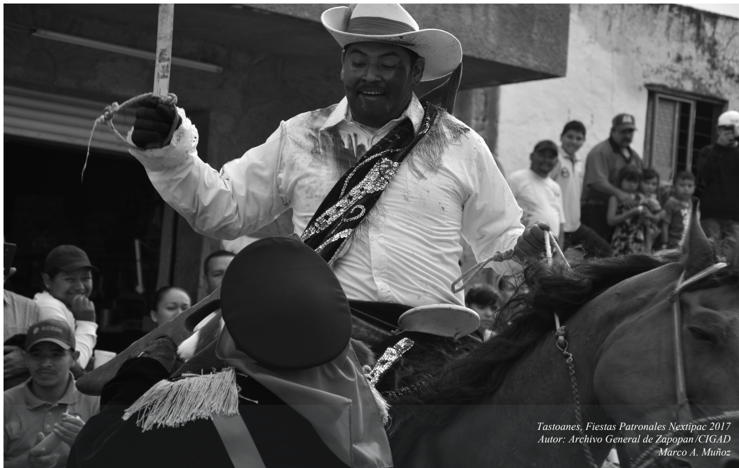
Tastoanes, Fiestas Patronales Nextipac 2017

CONVOCATORIA PARA LA TOMA DE PROTESTA DE LEY DE LOS CONSEJEROS SOCIALES CONFORMADOS EN EL MUNICIPIO DE ZAPOPAN, JALISCO.