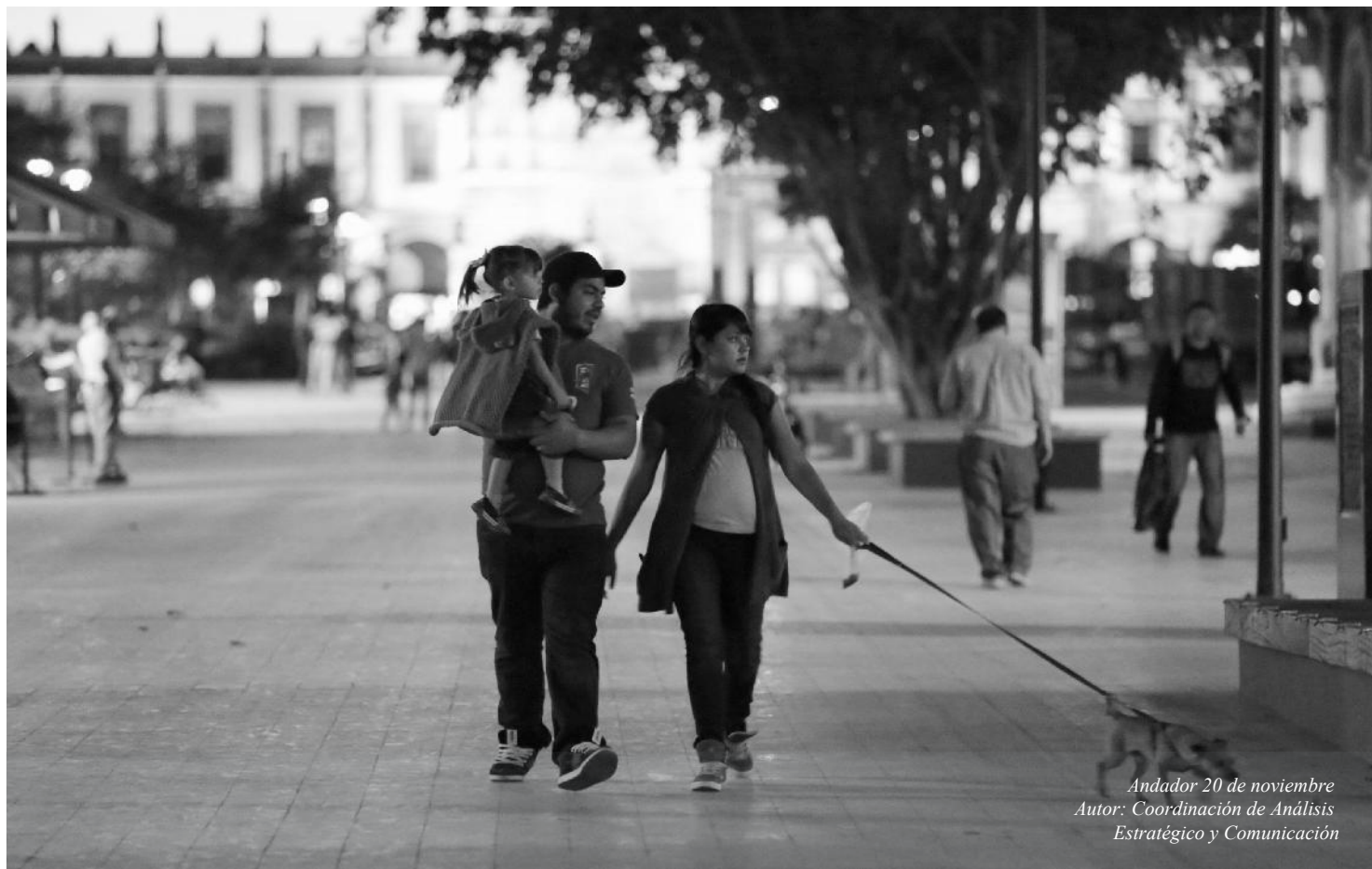
Andador 20 de noviembre Autor: Coordinación de Análisis Estratégico y Comunicación

RESUMEN DE DICTÁMENES DE ACREDITACIÓN DE LOS PREDIOS: COLINAS DE SAN MIGUEL (19), LA VINATERA (18), EL CAMICHINITO (8), ANEXO A JARDINES DE SAN ANTONIO (6), PARCELA 110 ZO P9/9 (2), LOMAS DEL BATÁN (2), SANTA CLARA II (2), PARCELA 105 ZO P9/9 (2), JARDINES DE LA ENRAMADA (2), JUAN GIL PRECIADO (2), EJIDO ZAPOPAN (PARCELA 19) (1), COLINAS DE LOS BELENES (1), EL FRESNO I (1), LOS COLORINES (1), JARDINES DE SAN ANTONIO (1), LA TUZANIA EJIDAL (1), HÉROES NACIONALES (1), LOS CAPULINES (1) MUNICIPIO DE ZAPOPAN, JALISCO.