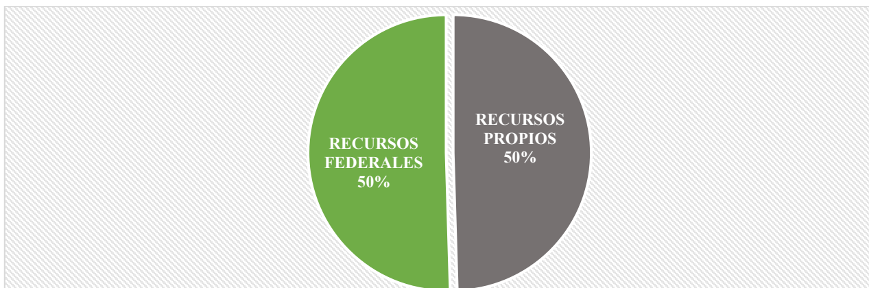
Gráfico de la Clasificación por Fuente de Financiamiento

Para todo lo anterior, en la formulación del Presupuesto de Egresos 2018 se considera el equilibrio presupuestal en todo momento, por lo tanto, los ingresos a obtener corresponden a recursos propios, y recursos federales correspondientes a las participaciones federales y estatales (Ramo 28), así como las fuentes de recursos que provienen del Fondo de Aportaciones Federales (Ramo 33), conforme al siguiente cuadro: