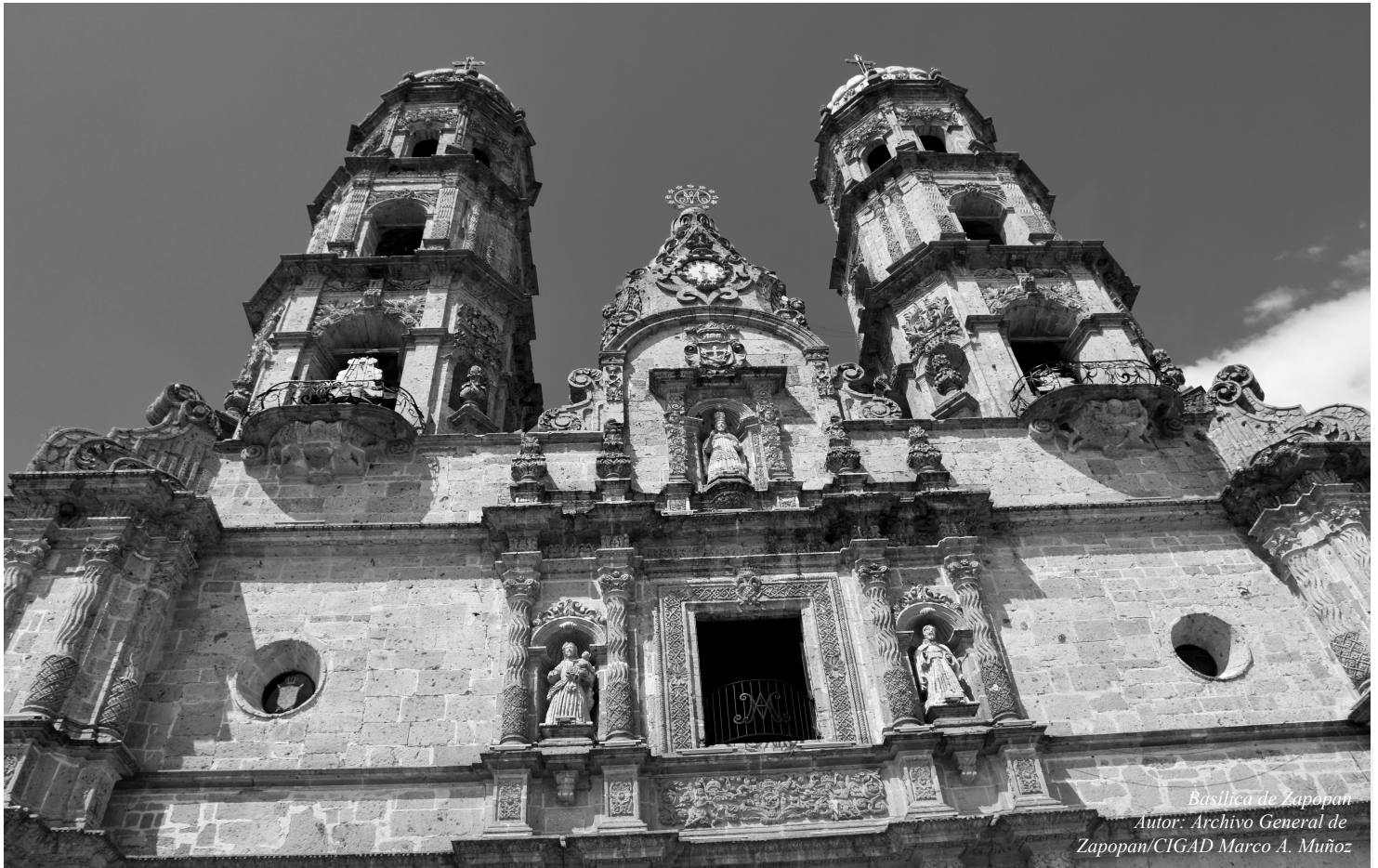
Basilica de Zapopan

PRESUPUESTO DE EGRESOS DEL MUNICIPIO DE ZAPOPAN, JALISCO, PARA EL EJERCICIO FISCAL 2018.