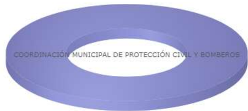
COORDINACIÓN MUNICIPAL DE PROTECCIÓN CIVIL Y BOMBEROS