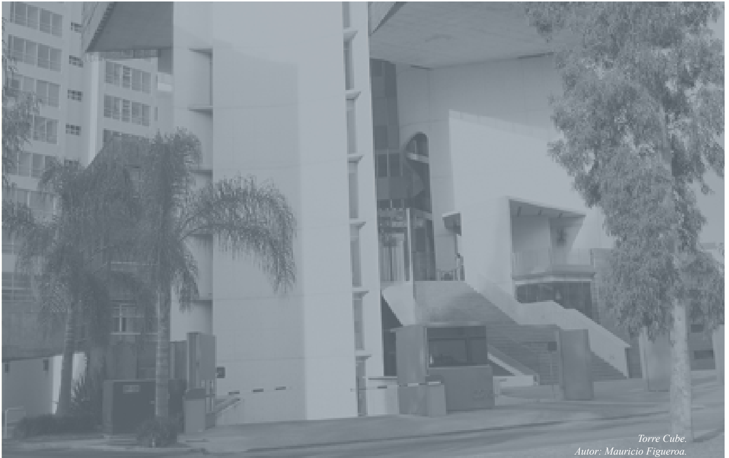
Torre Cube. Autor: Mauricio Figueroa.

DICTAMEN DE TITULACIÓN DE PREDIO, UBICADO EN EL FRACCIONAMIENTO EJIDO ZAPOPAN (PARCELA 19)