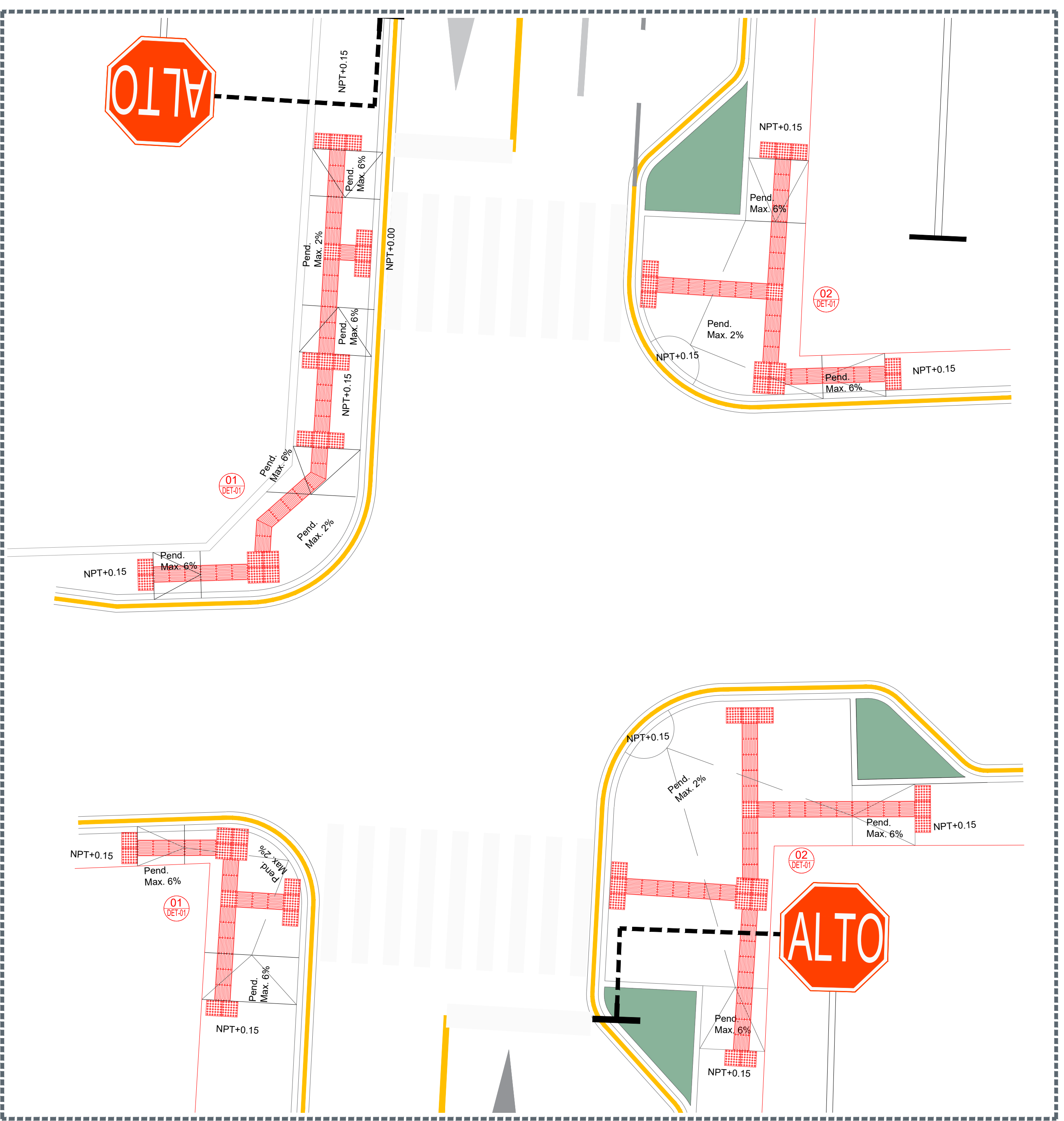
02 Crucero Seguro Escala 1:75