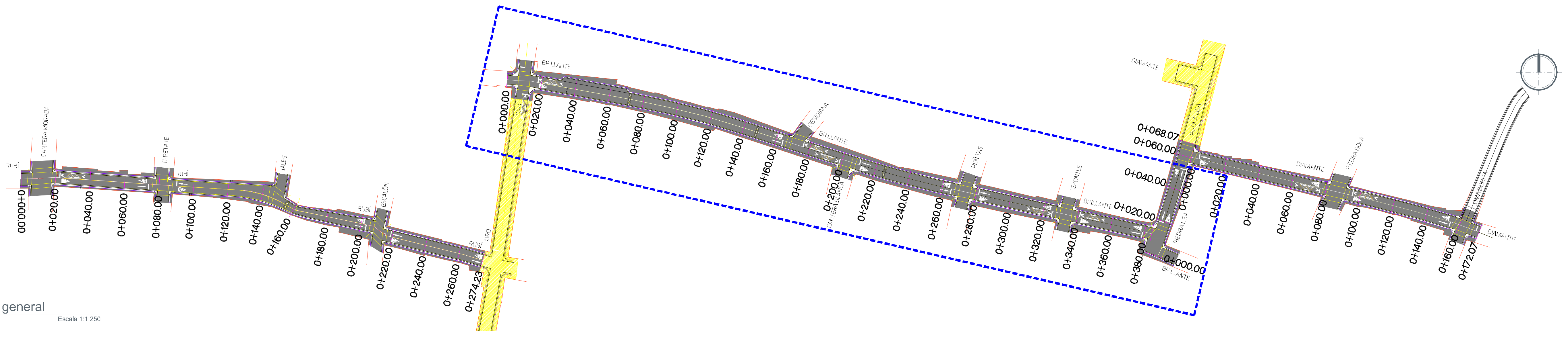
1 Planta general Escala 1:1,250

Nombre del proyecto: Modernización a la Red de Vía Urbana Balcones de la Cantera, frente 02, pavimentación con concreto hidráulico de la calle Brillante, incluye alcantarillado sanitario, agua potable, banquetas, cruces peatonales, accesibilidad universal, señalética horizontal - vertical y obras complementarias, colonia Balcones de la Cantera, Municipio de Zapopan, Jalisco Contenido del plano: Plantas generales No. Contrato: DOPI-MUN-PP-PAV-LP-077-2022 Director de Obras Públicas e Infraestructura: Ing. Ismael Jáuregui Castañeda Jefe de la Unidad de Estudios y Proyectos: Arq. Edwin Aguilar Escatel Jefe de Área: Ingr. Norberto Esaú Romero Joya Responsable del proyecto: Ubicación: Col. Balcones de la Cantera, Zapopan, Jalisco Norte: Indicado en el dibujo Fecha: junio 2022 Escala: Indicada Clave: ARQ-01 Acotaciones: Metros