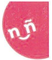
ARANZA ELIZABETH GALLARDO ROMERO TITULAR DEL INSTITUTO DE LAS JUVENTUDES