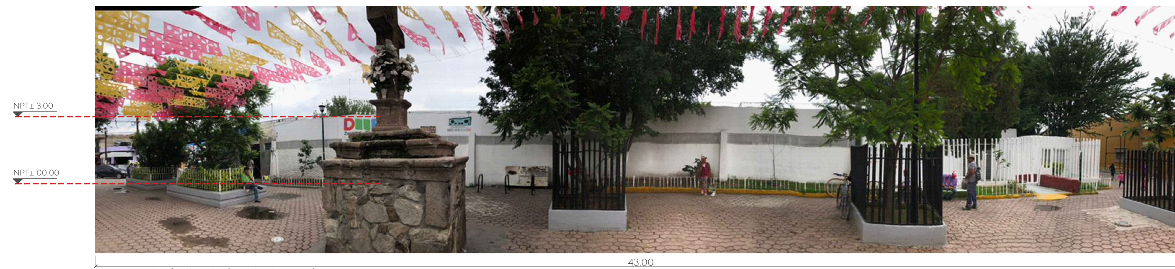
04 Tren de fachada (Andador DIF) Detalle S/E