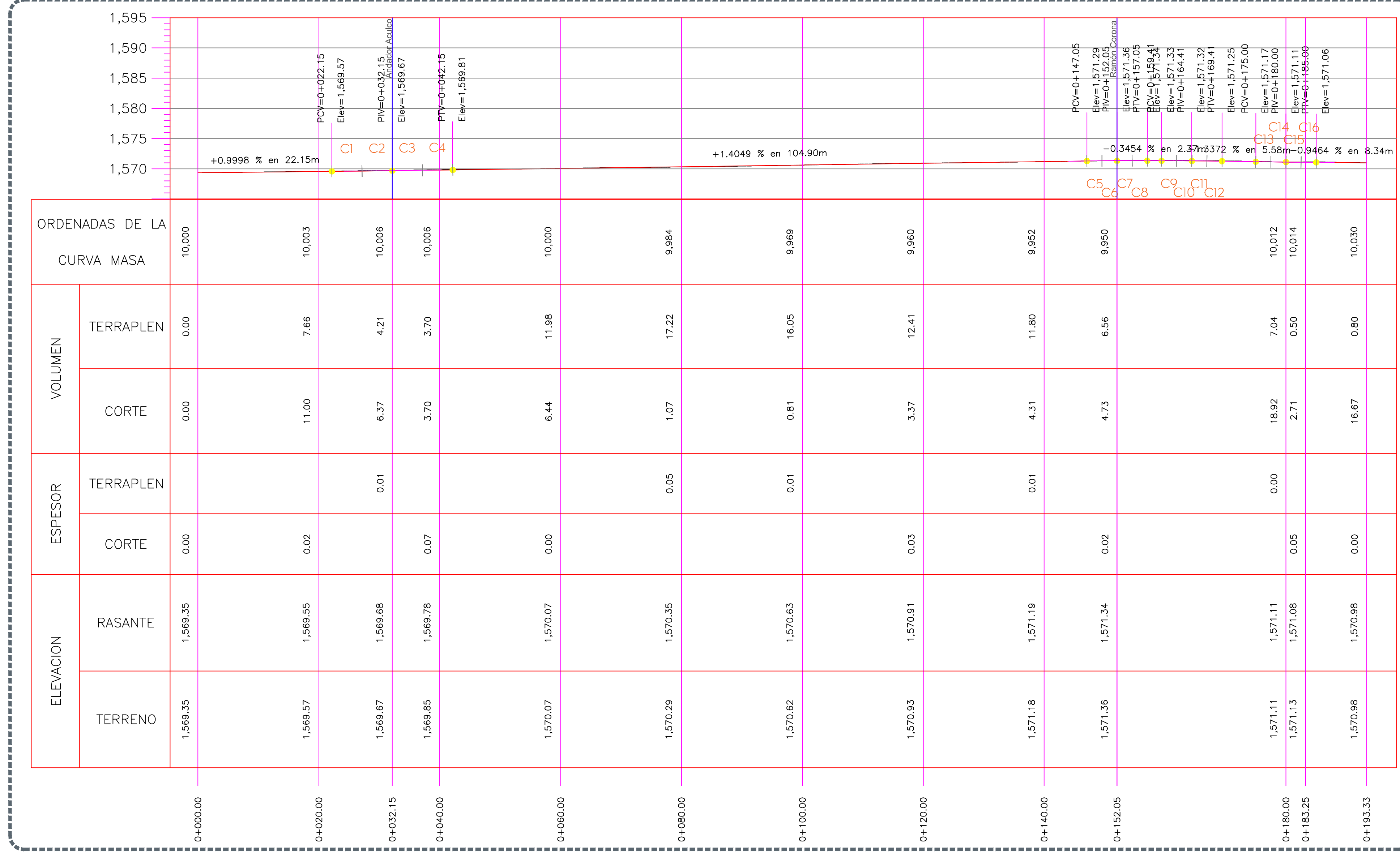
2 Perfil 0+000.00 a 0+193.33 Escala 1 : 450