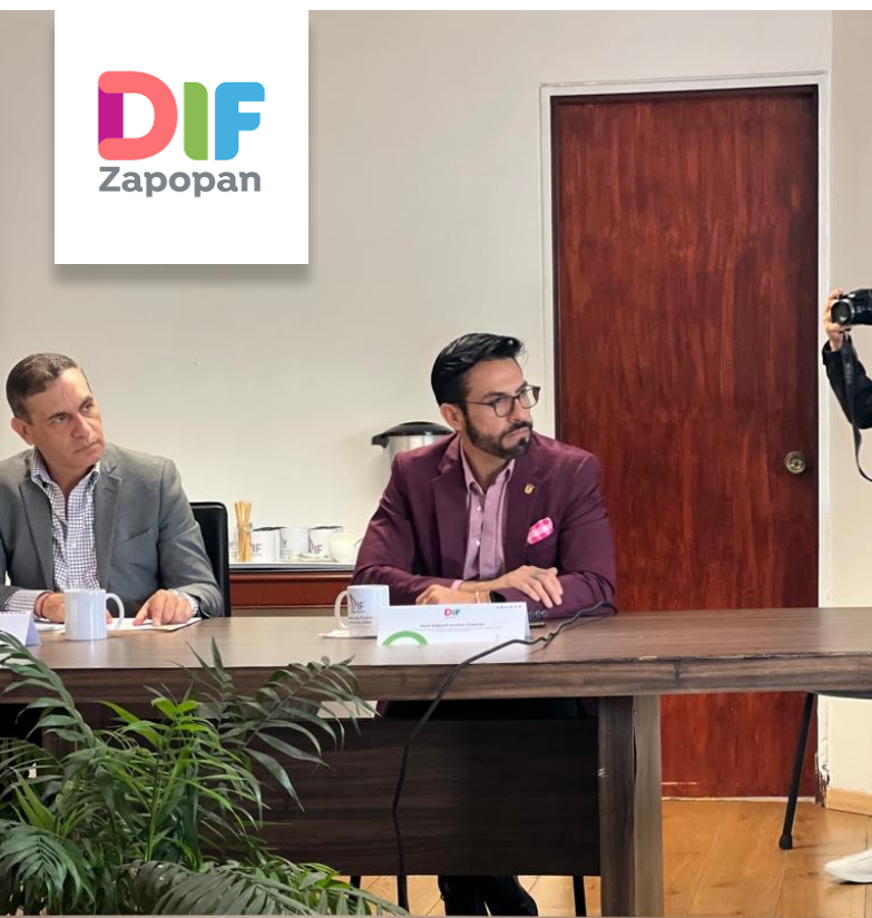
Patronato del DIF Zapopan