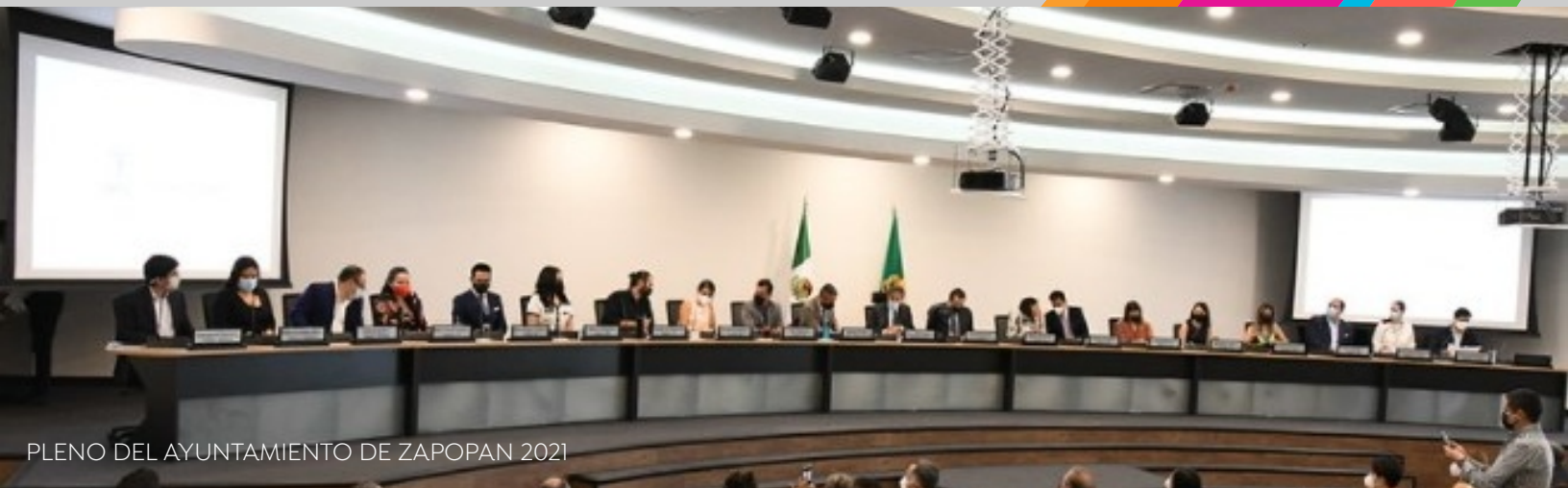
PLENO DEL AYUNTAMIENTO DE ZAPOPAN 2021