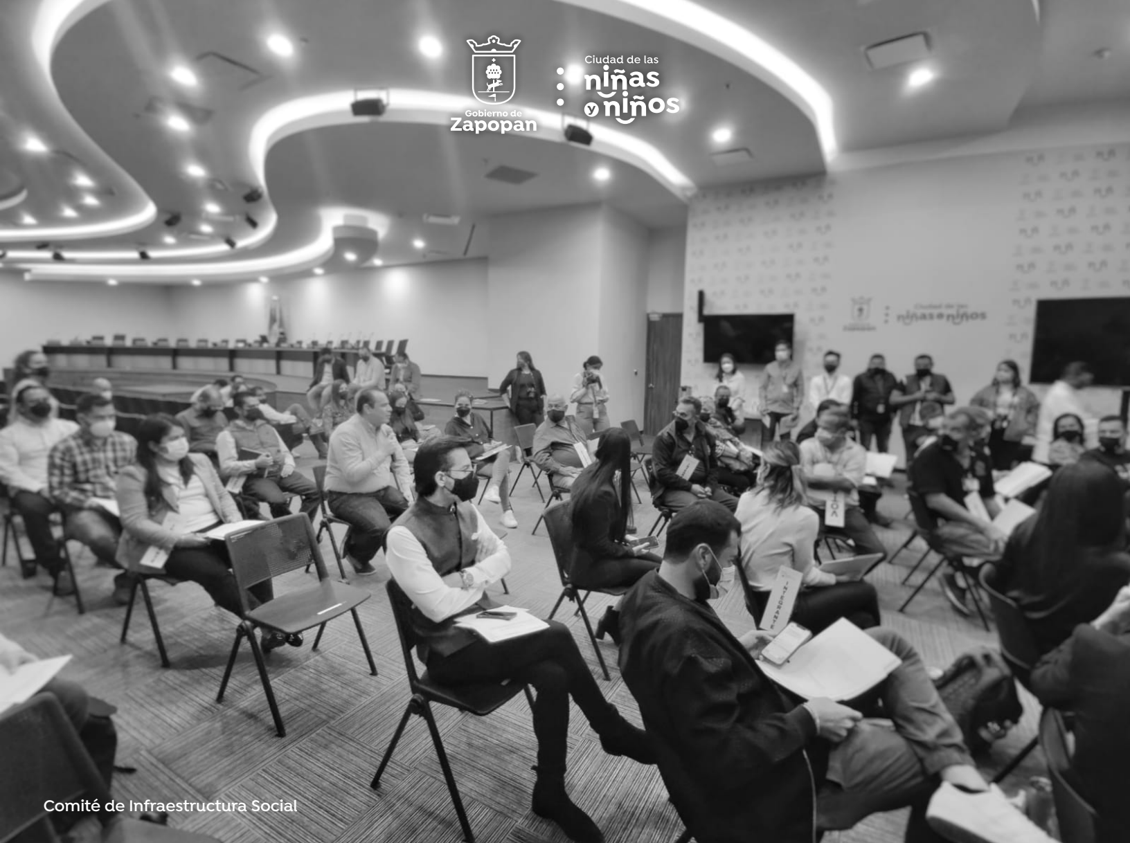
Comité de Infraestructura Social