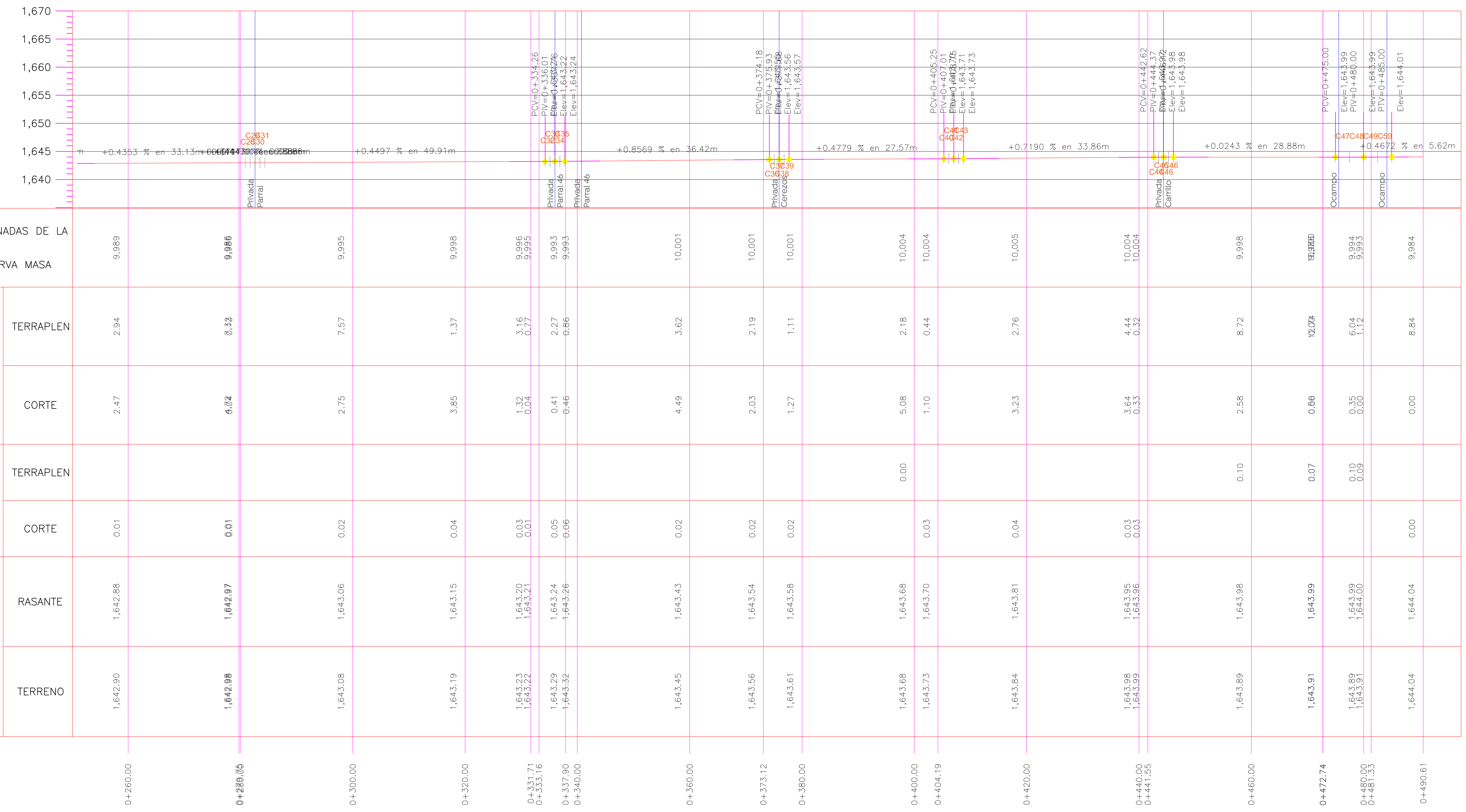
Perfil Escala 1:400