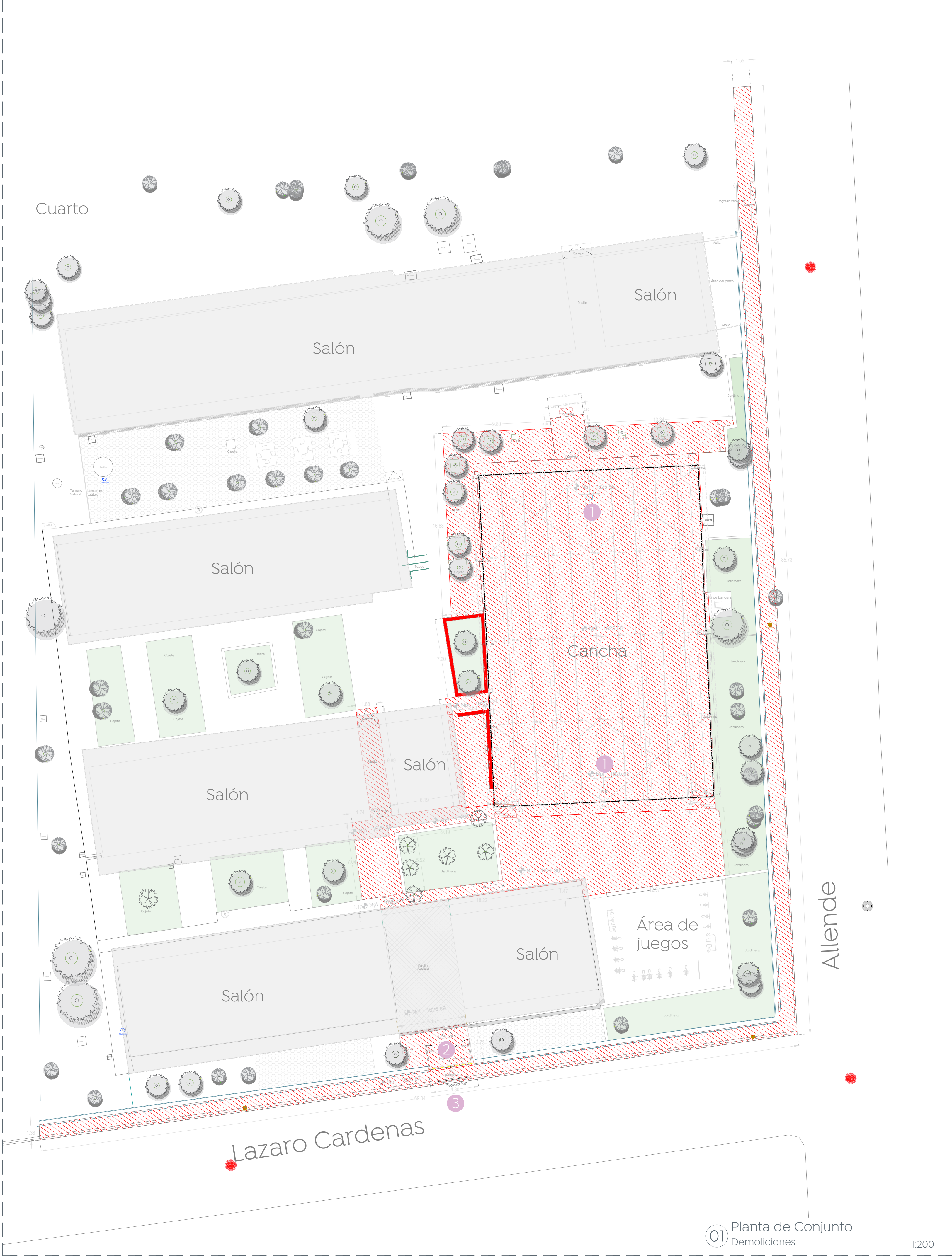
01 Planta de Conjunto Demoliciones 1:200