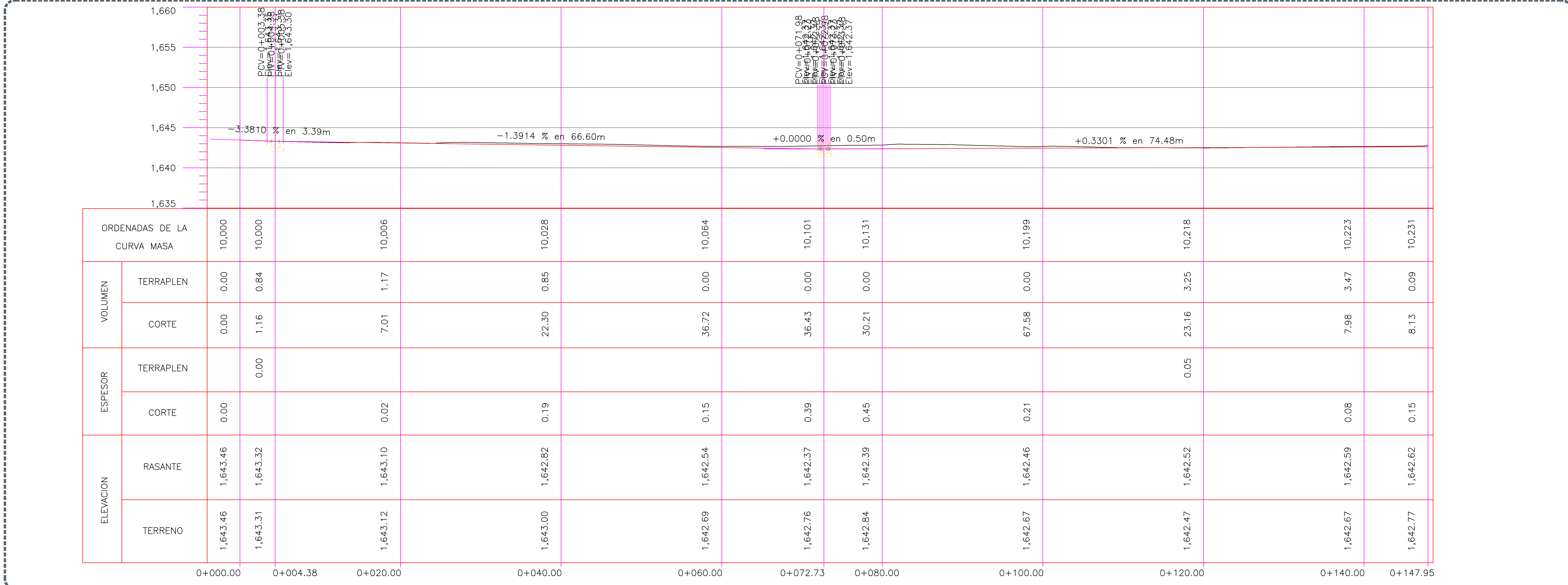
2 Perfil 0+000.00 a 0+147.95 Escala 1:250