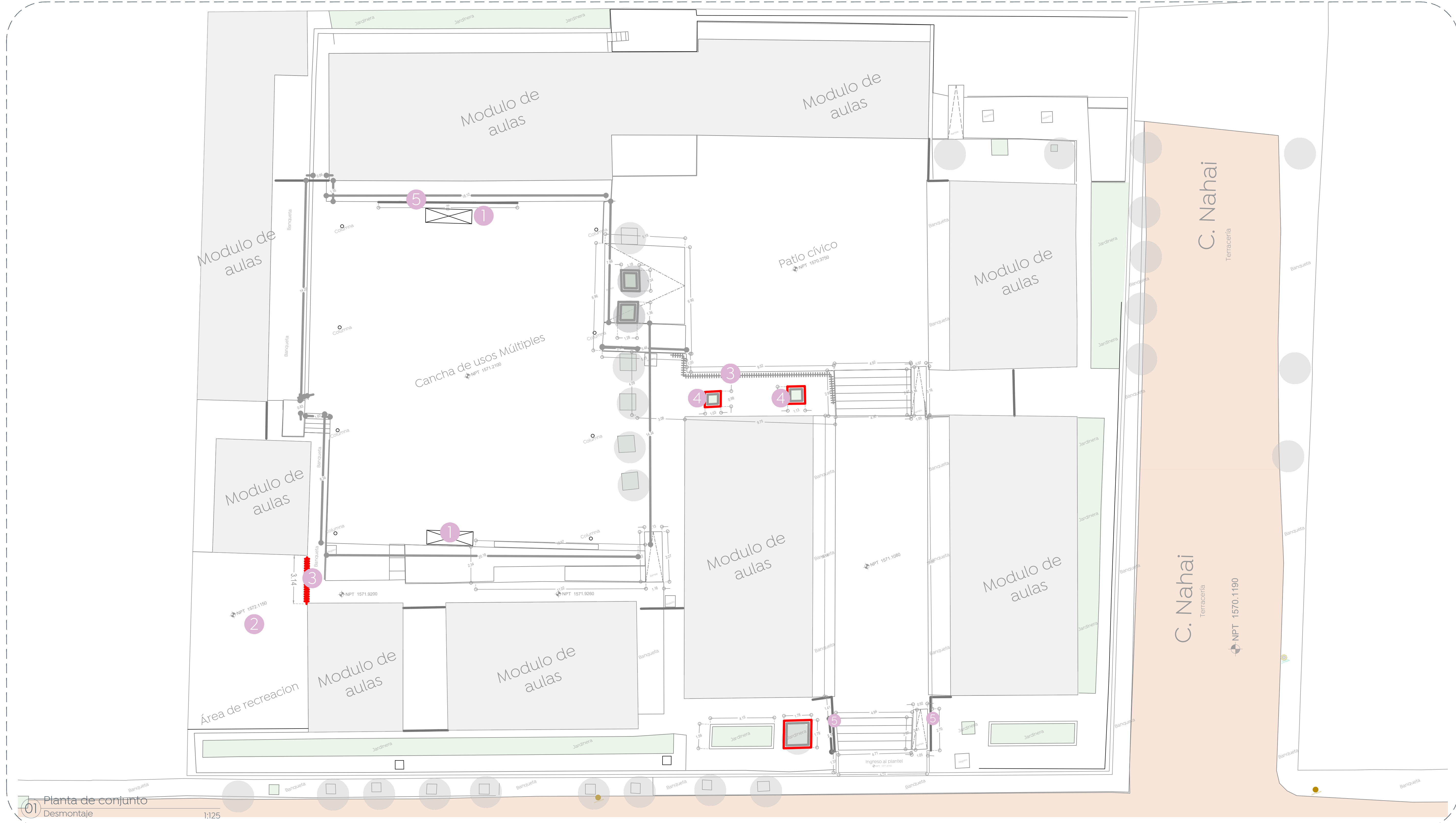
01 Planta de conjunto Desmontaje