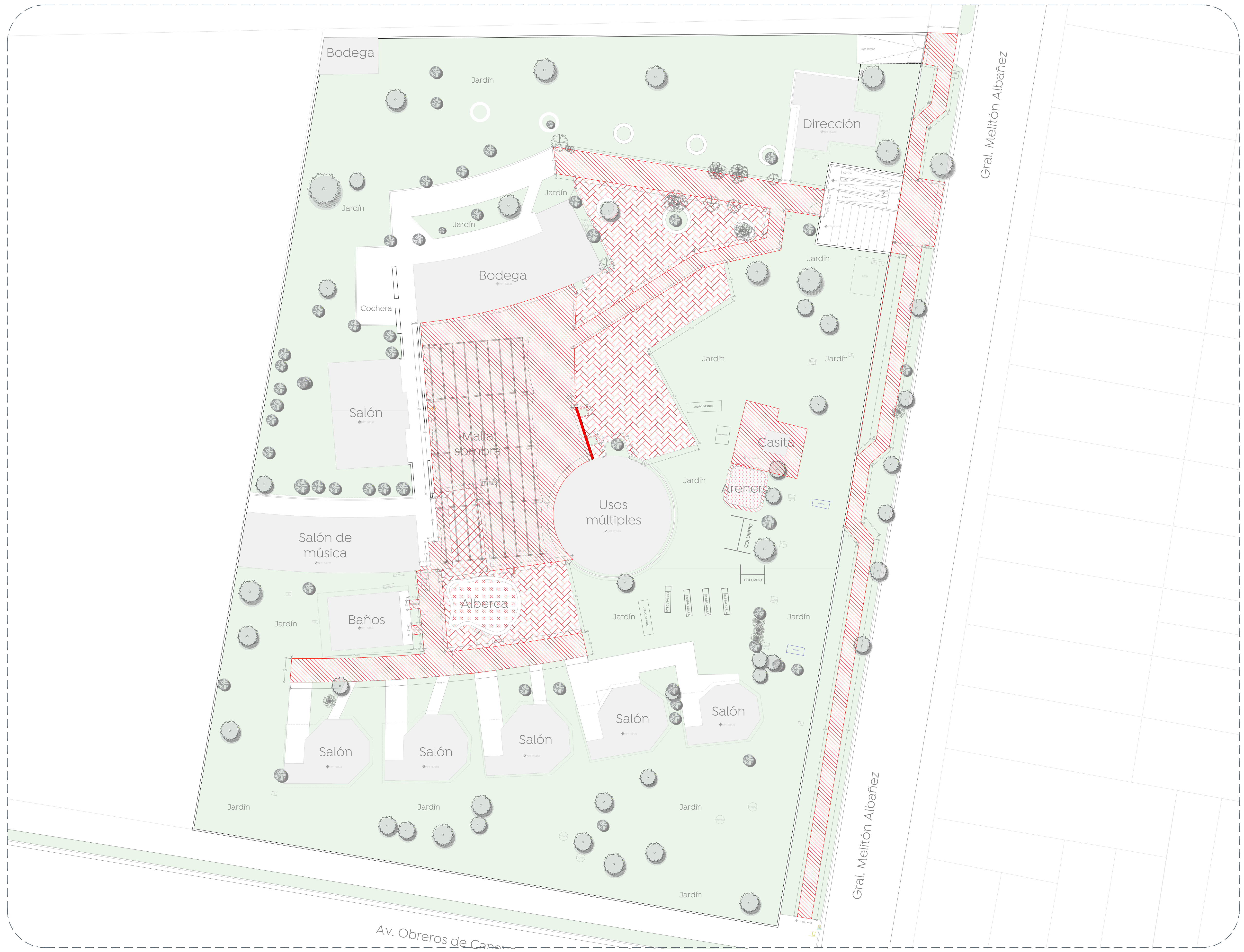
01 Planta de conjunto Demolición 1:200