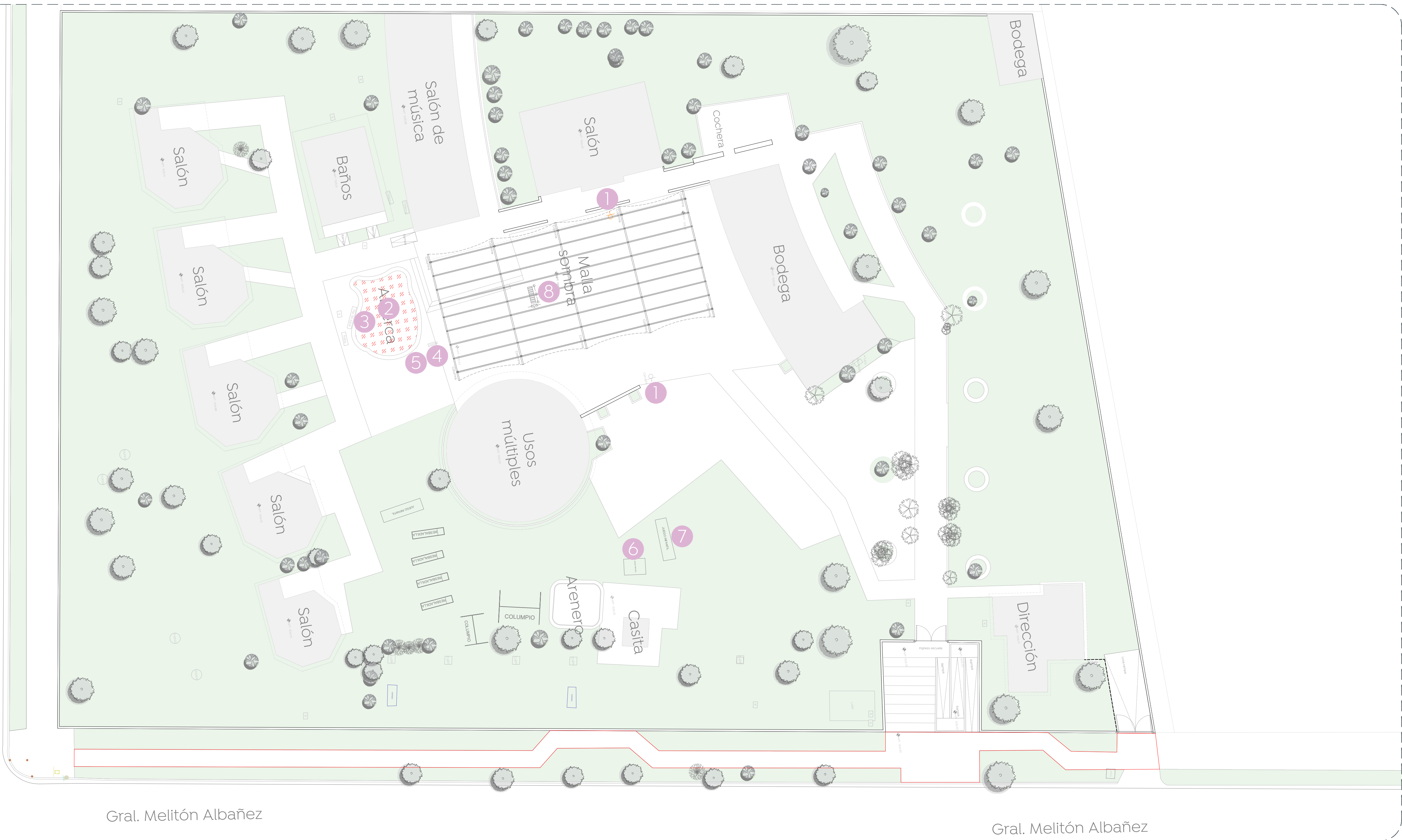
01 Planta de conjunto Desmontajes 1:200