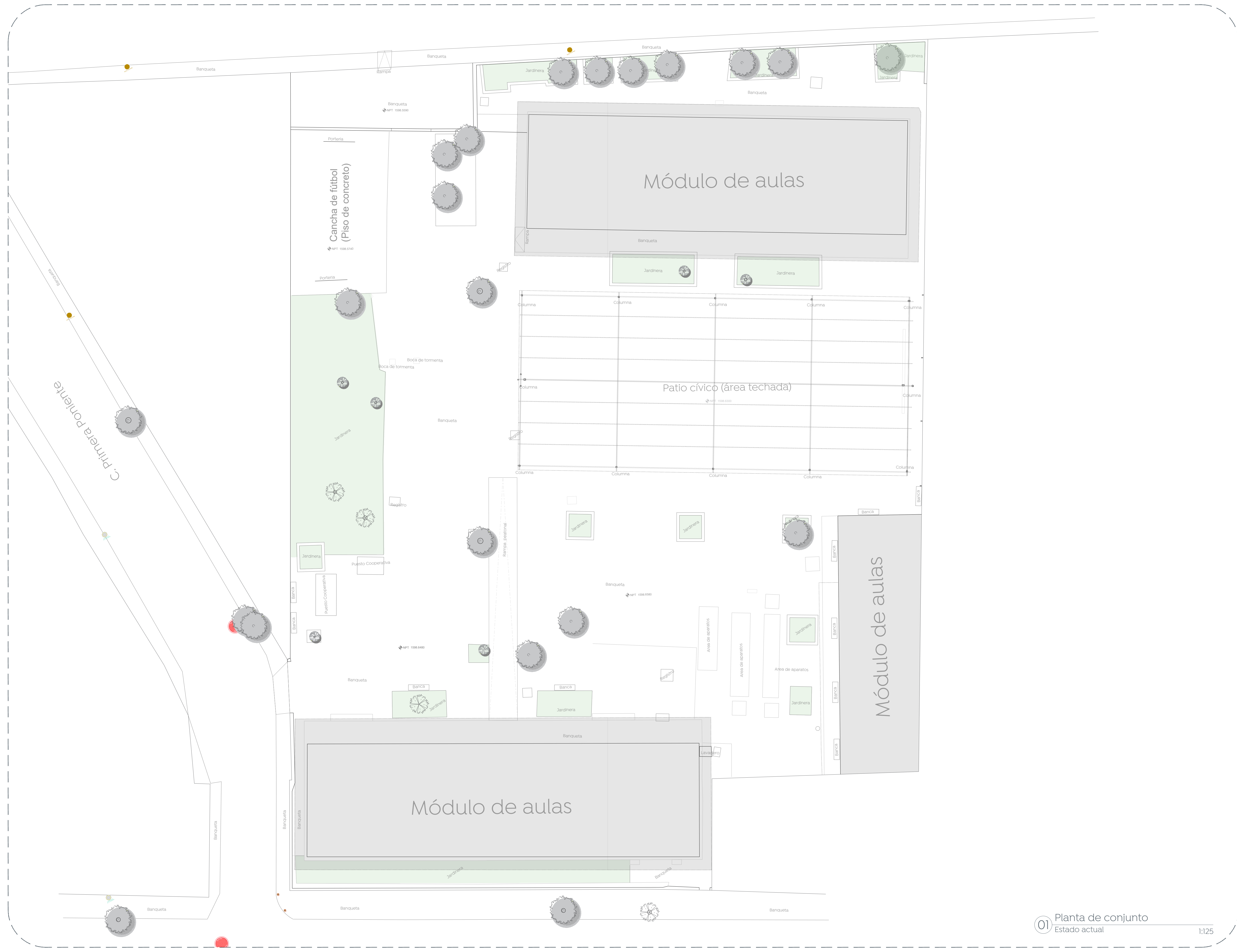
01 Planta de conjunto Estado actual 1:125