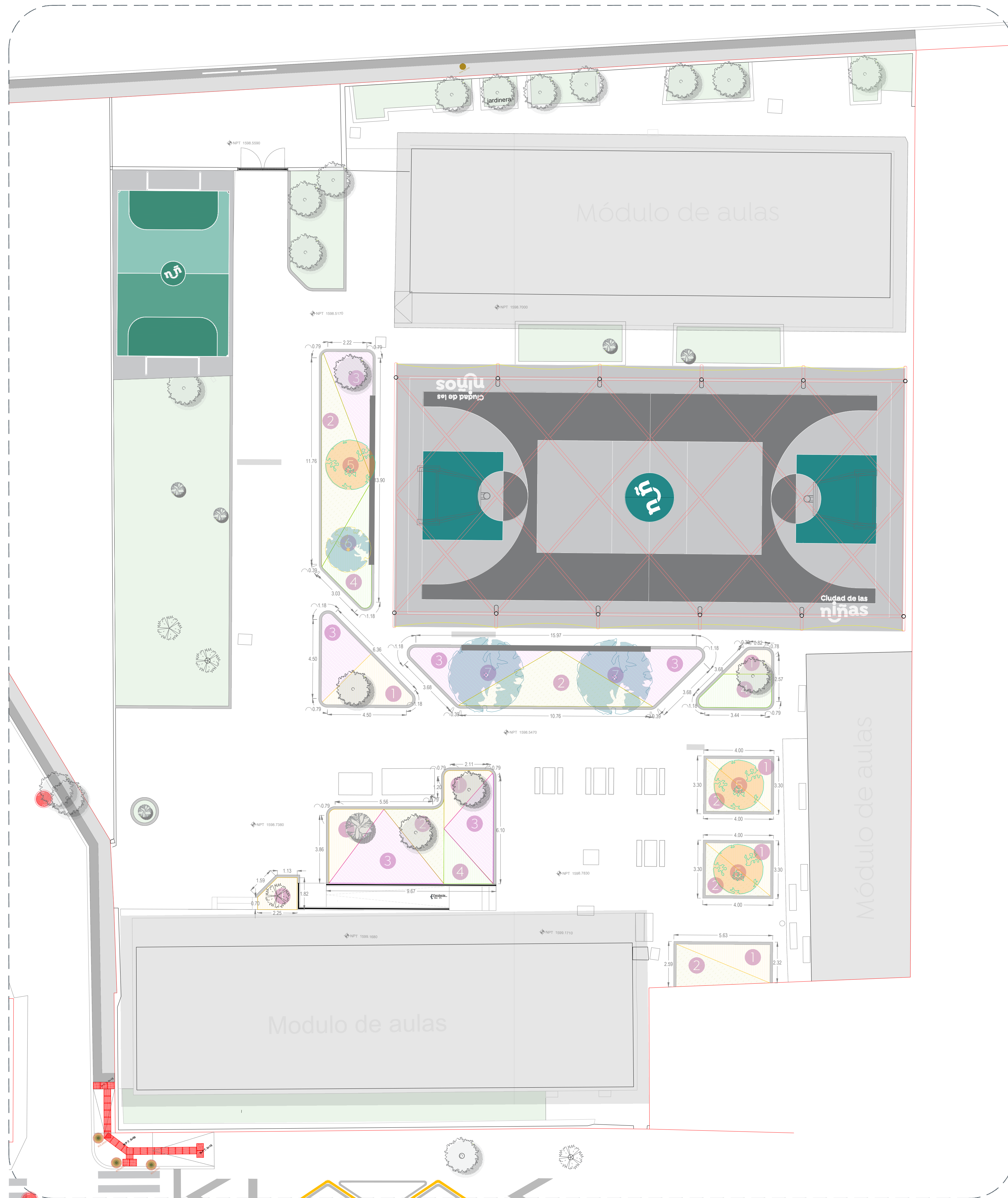
01 Planta de conjunto Vegetación 1:125