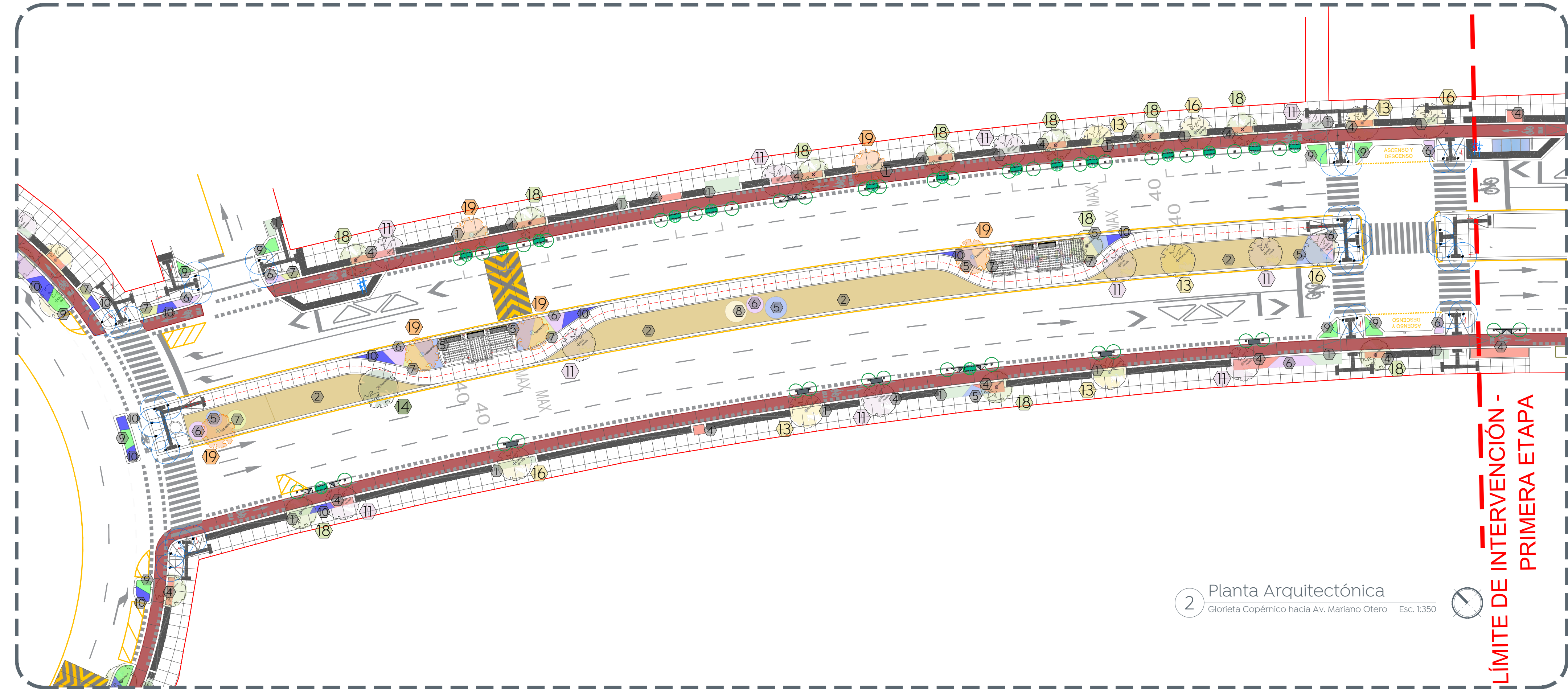
2 Planta Arquitectónica Glorieta Copérnico hacia Av. Mariano Otero Esc. 1:350