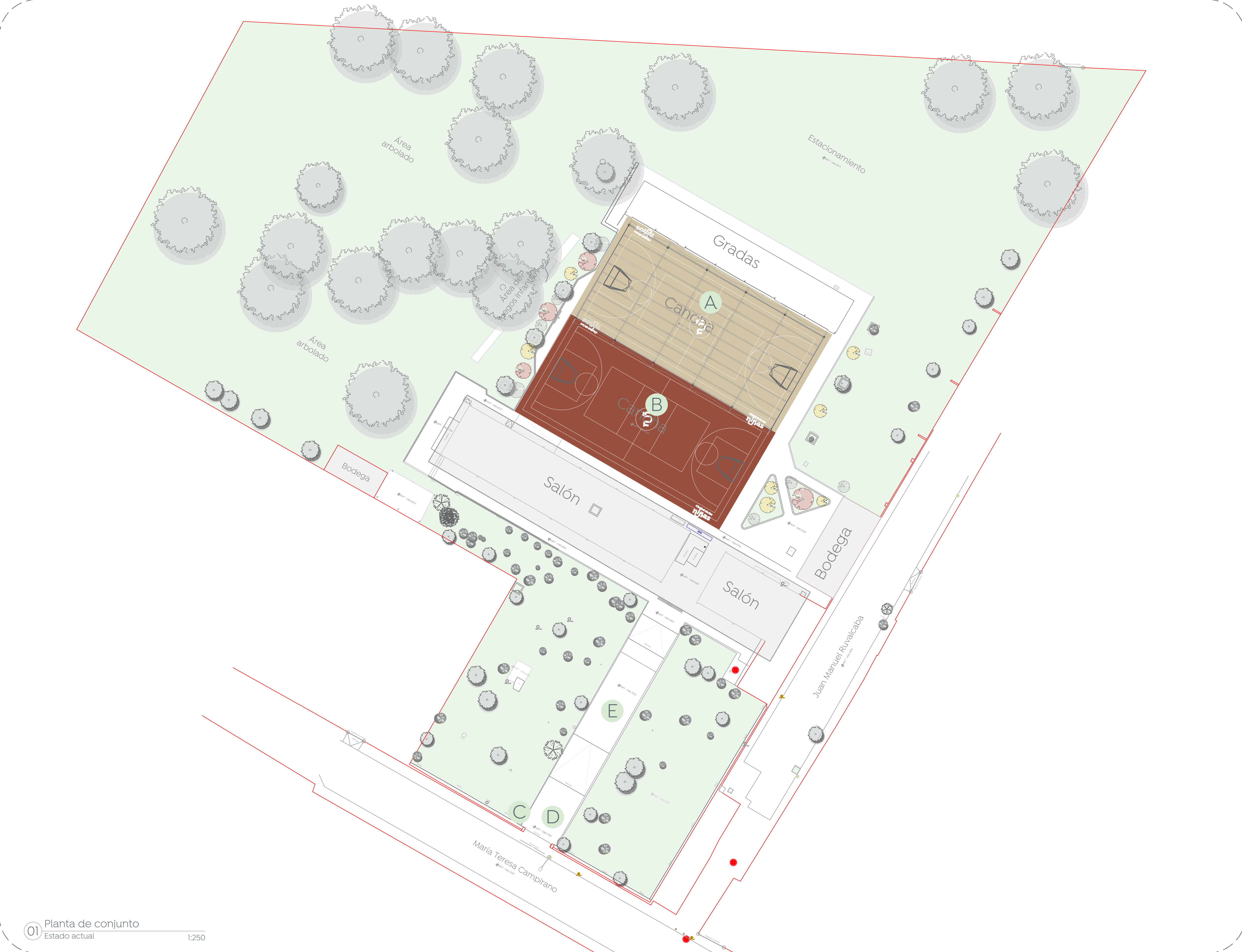
01 Planta de conjunto Estado actual 1:250