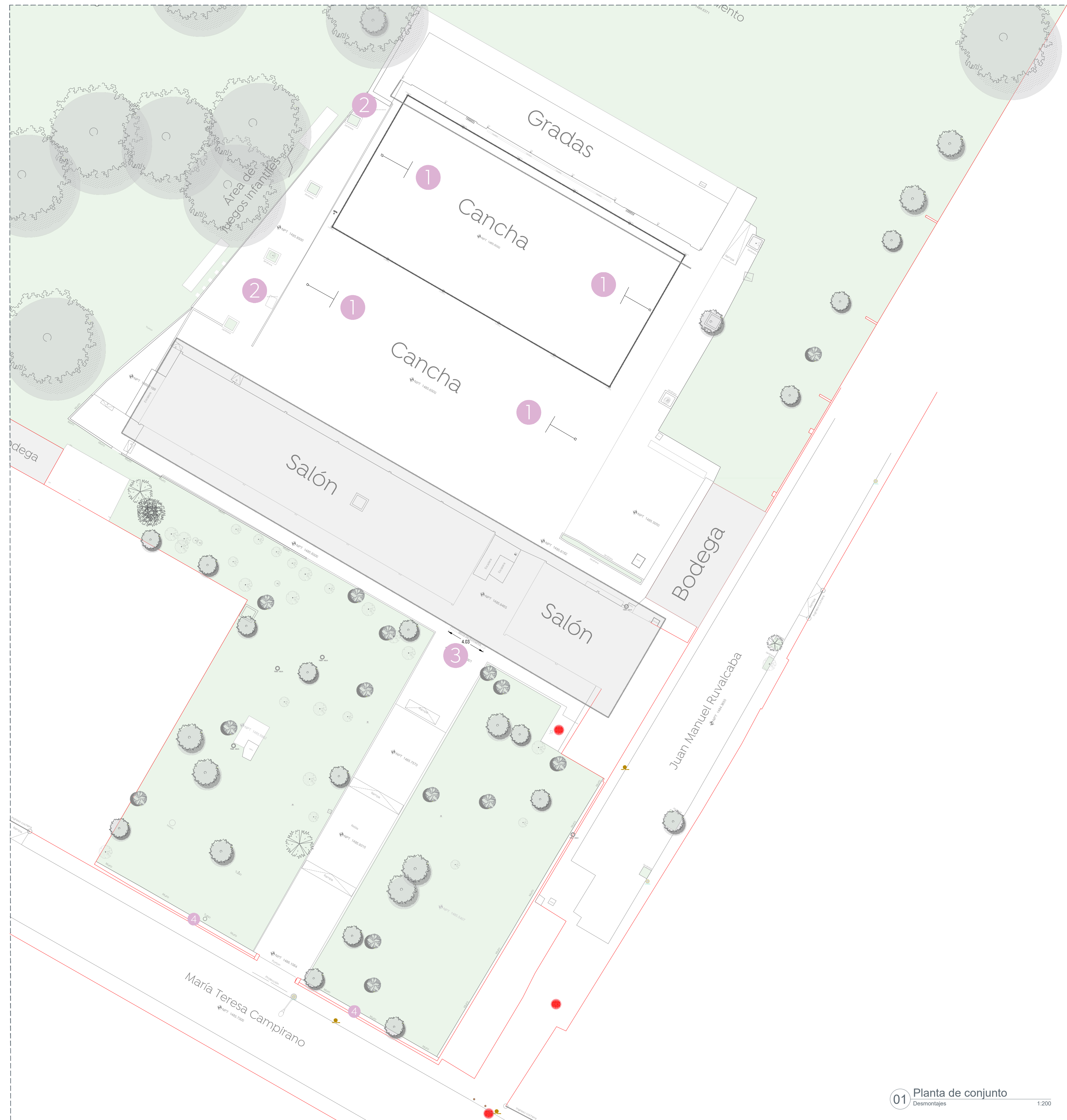
01 Planta de conjunto Desmontajes 1:200