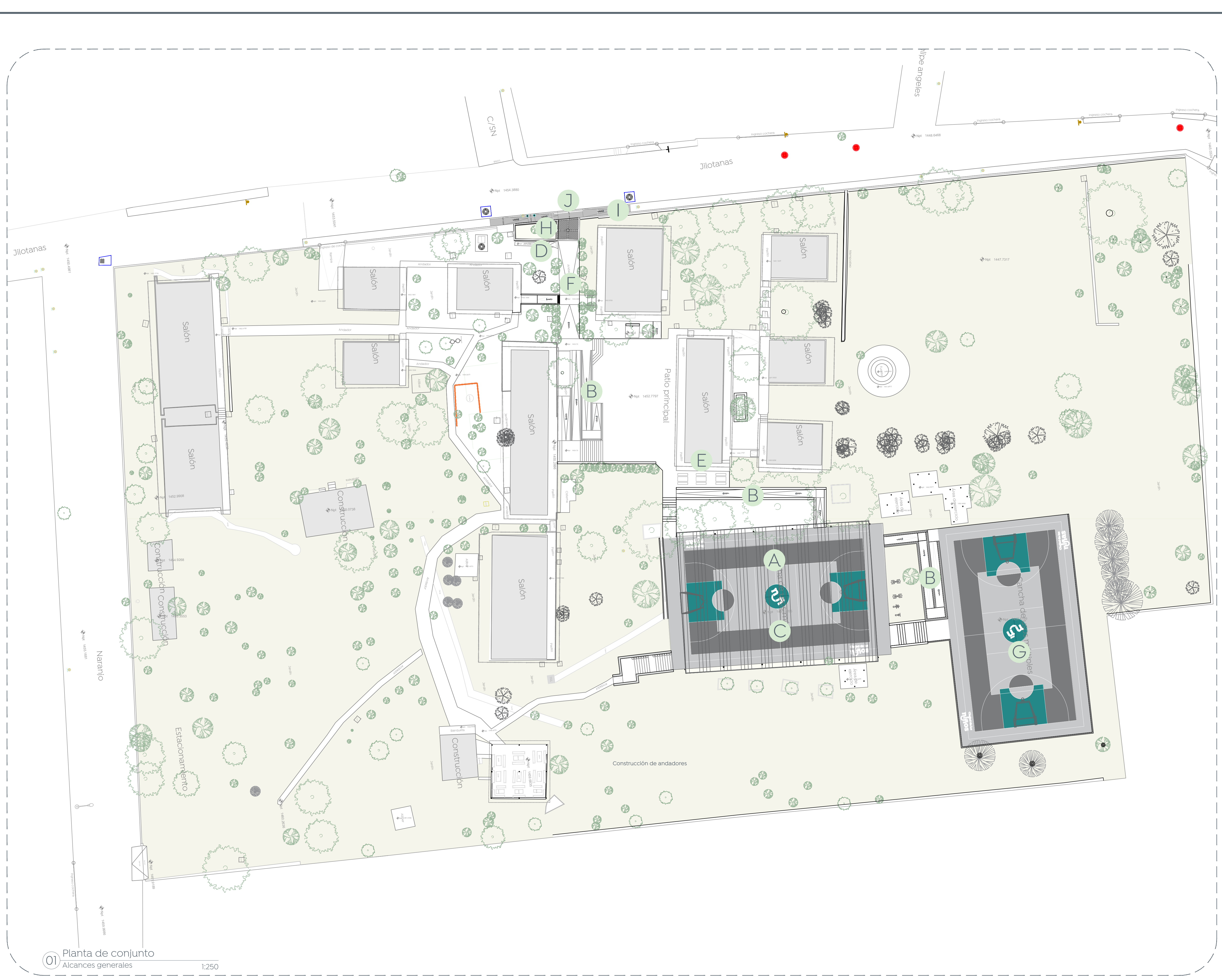
01 Planta de conjunto Alcances generales 1:250