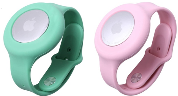
DISPOSITIVO DE LOCALIZACIÓN CON TECNOLOGÍA GPS