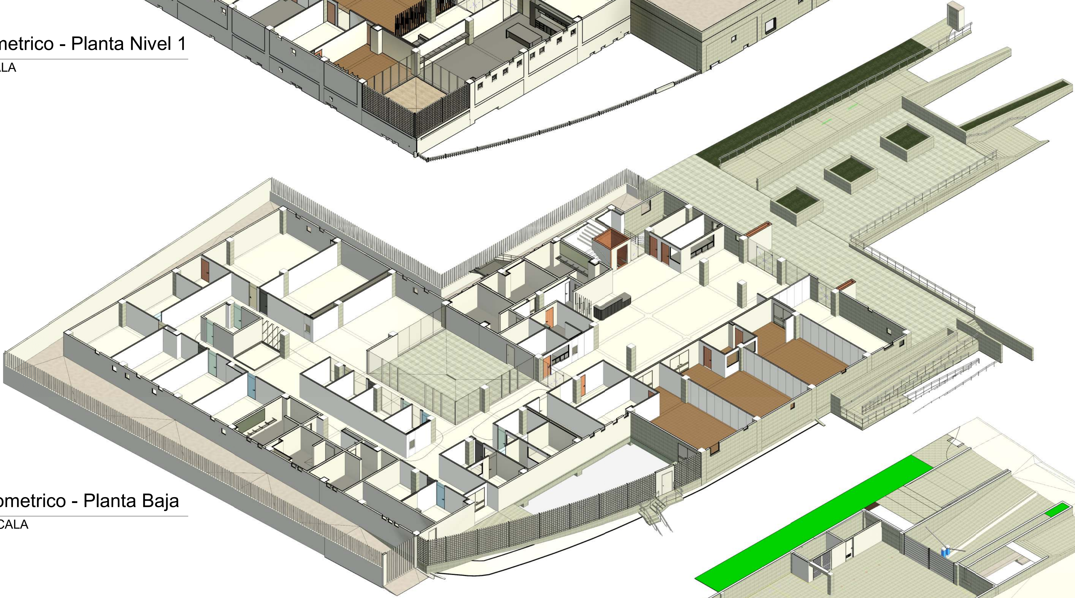
2 Isometrico - Planta Baja ESCALA