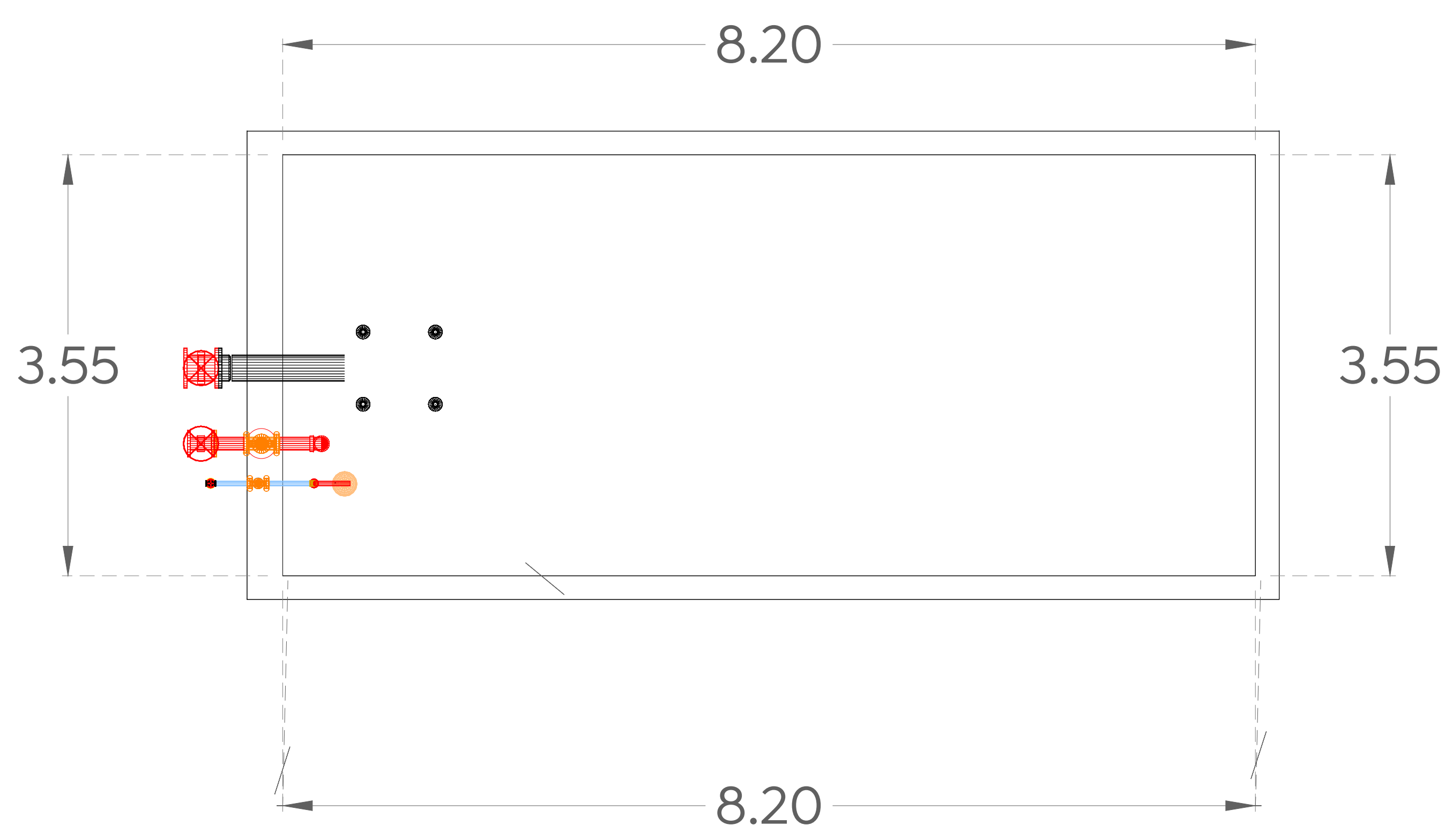
Detalle de Cisterna ESCALA S/E