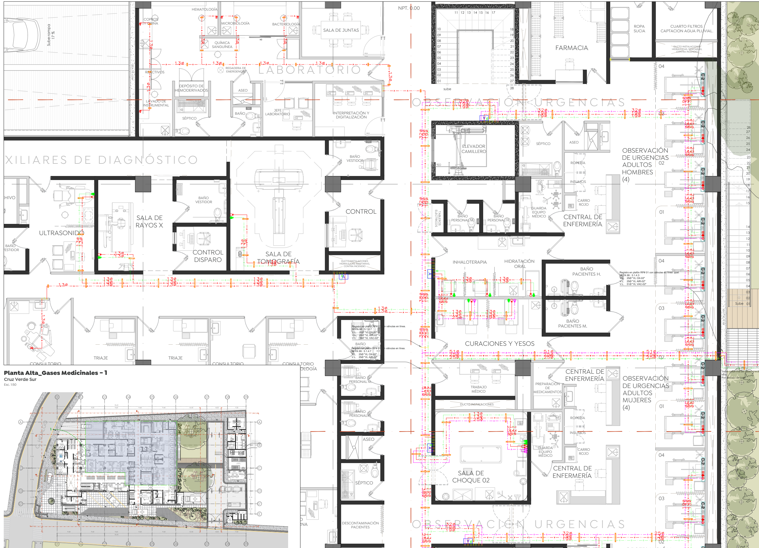
Planta Alta_Gases Medicinales - 1