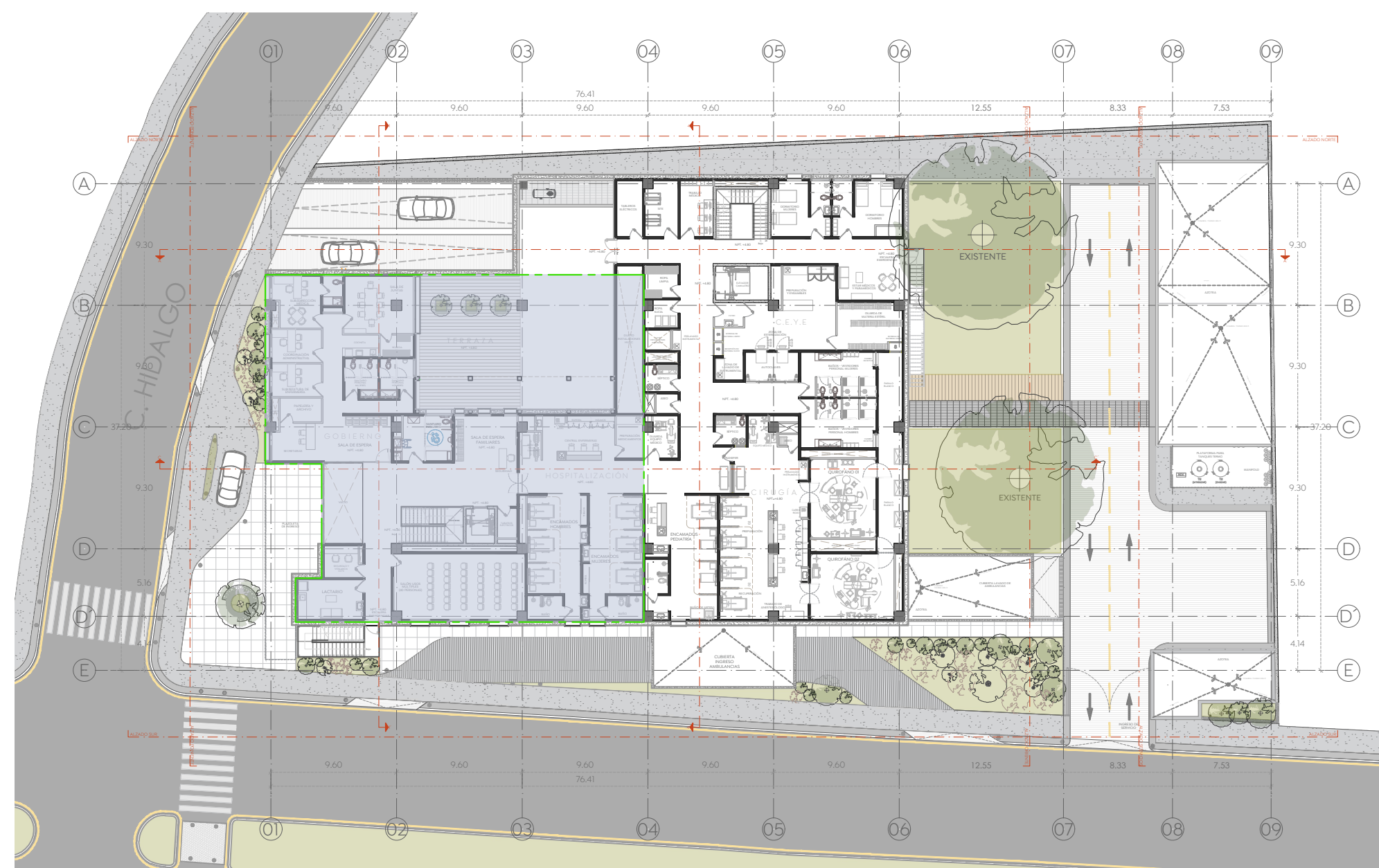
Planta Alta Arquitectónica Cruz Verde Sur 1/400