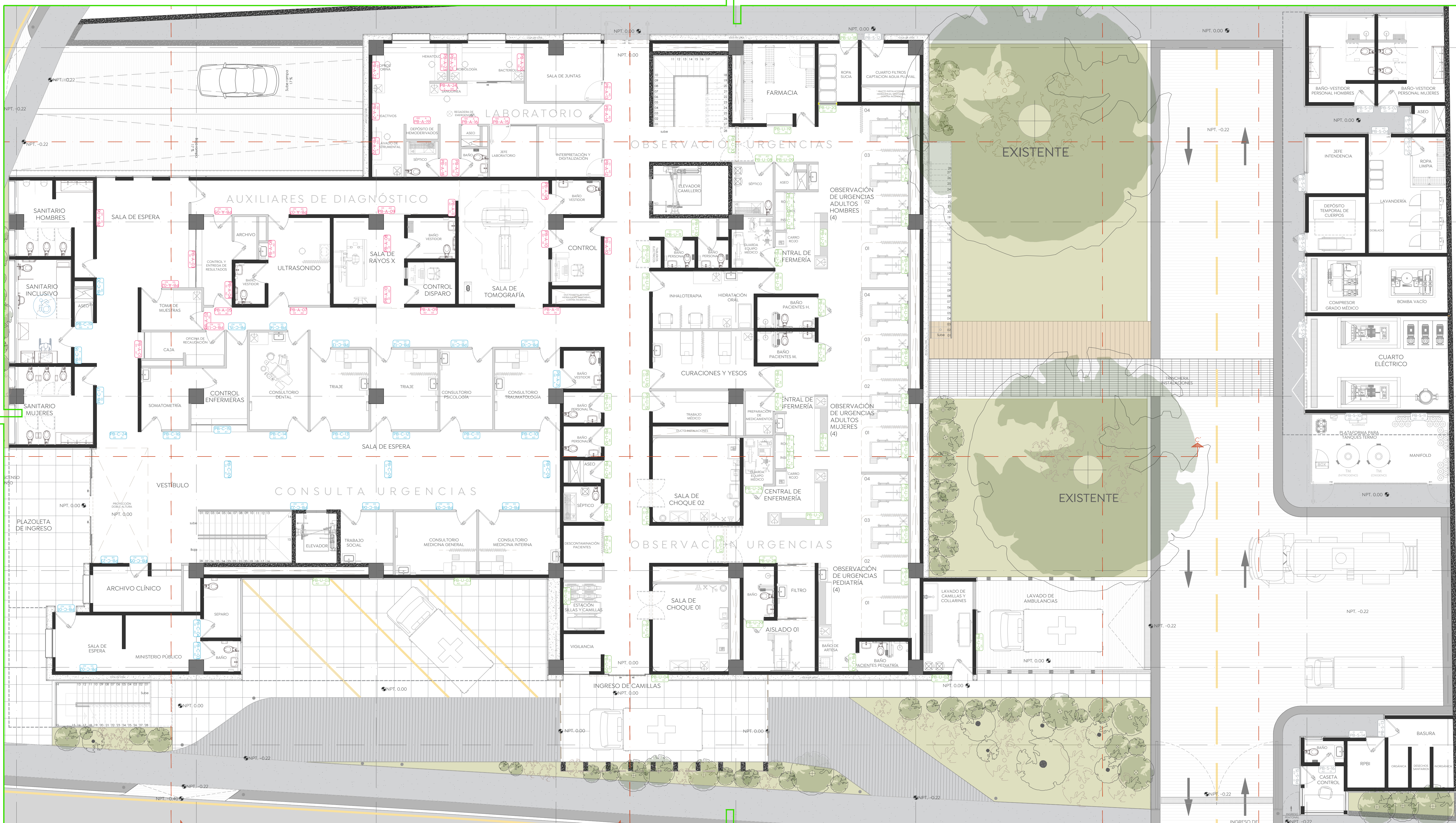
Planta Baja_Señalética Cruz Verde Sur Esc. 1:100

Acotaciones: cm Clave: Número: Revisión: - SN-02