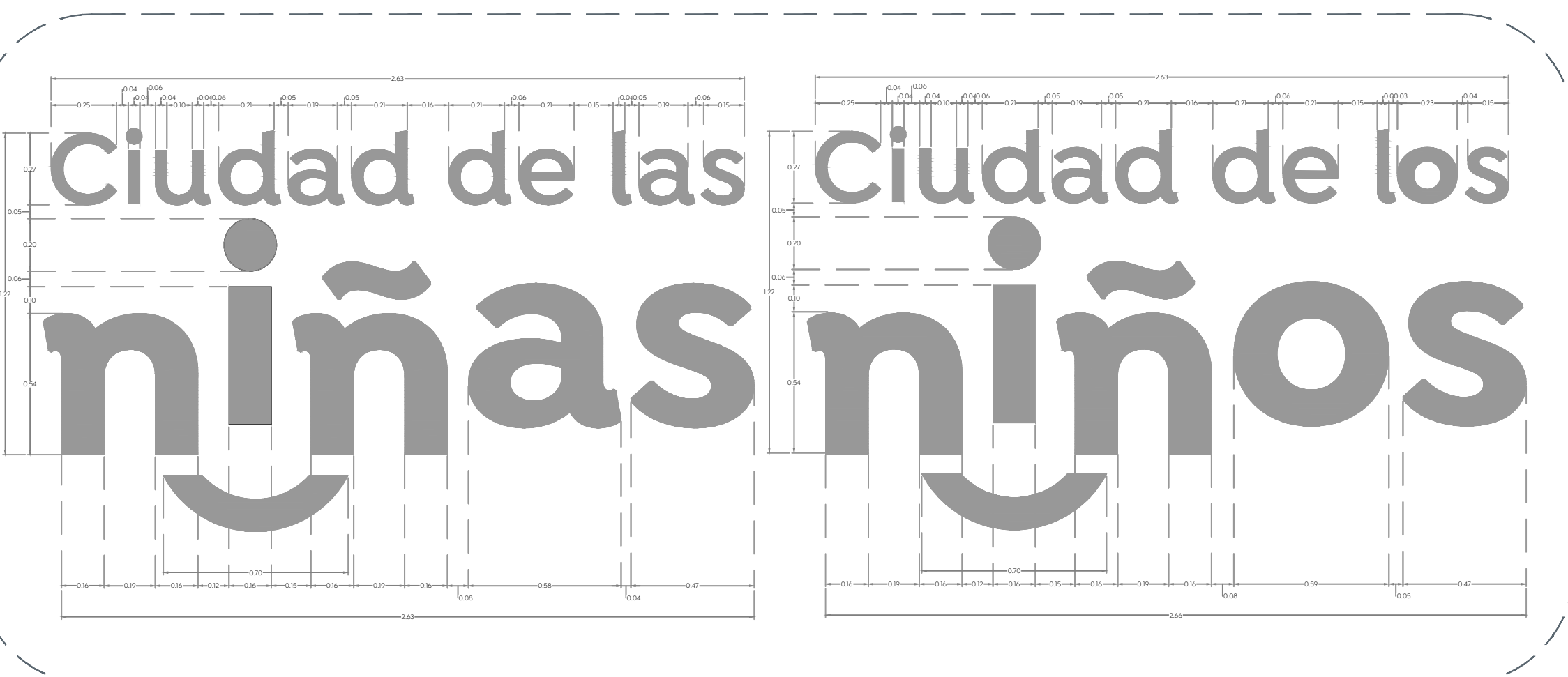
04 Detalle de balizamiento d.2 1:20