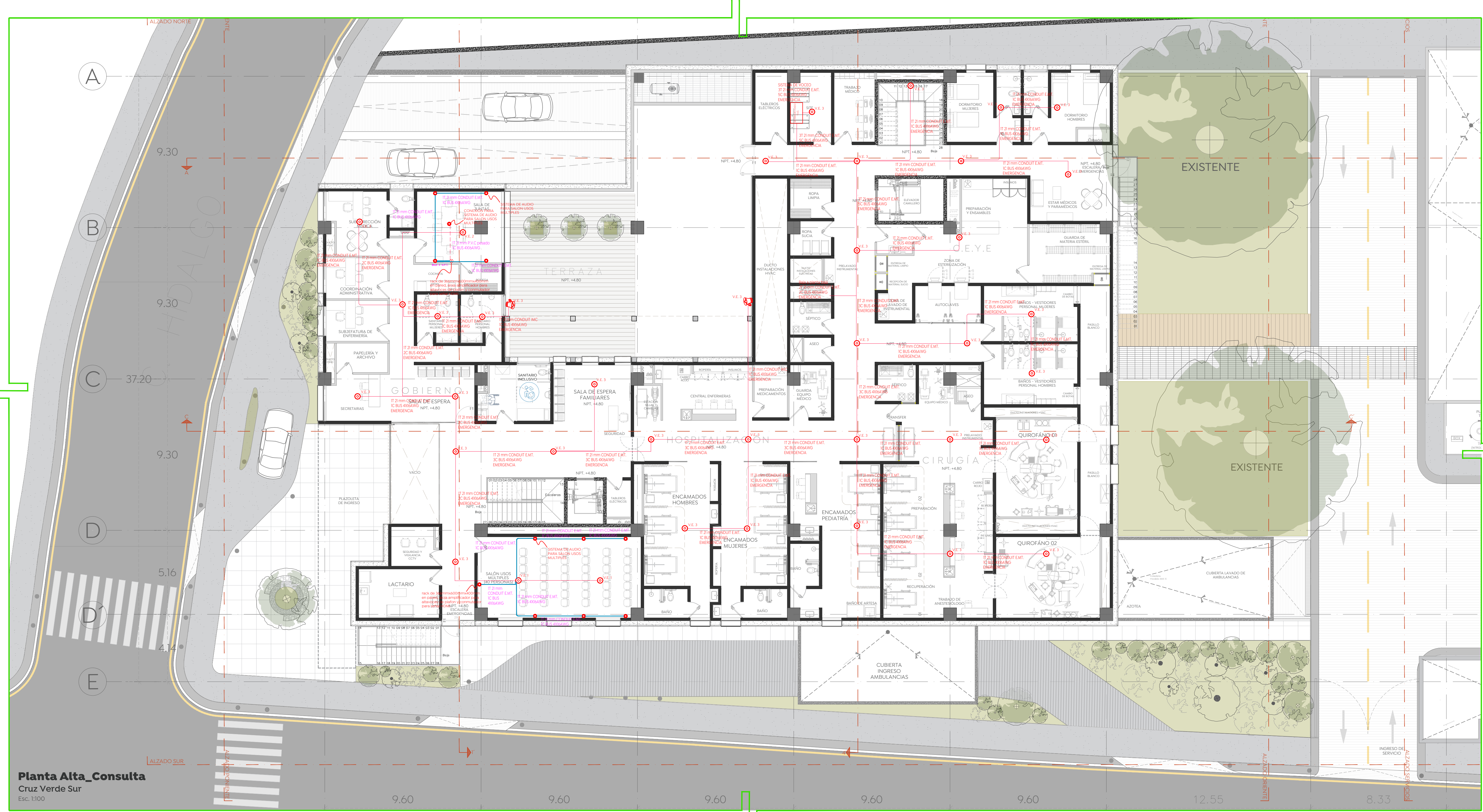
Planta Alta_Consulta Cruz Verde Sur Esc. 1:100