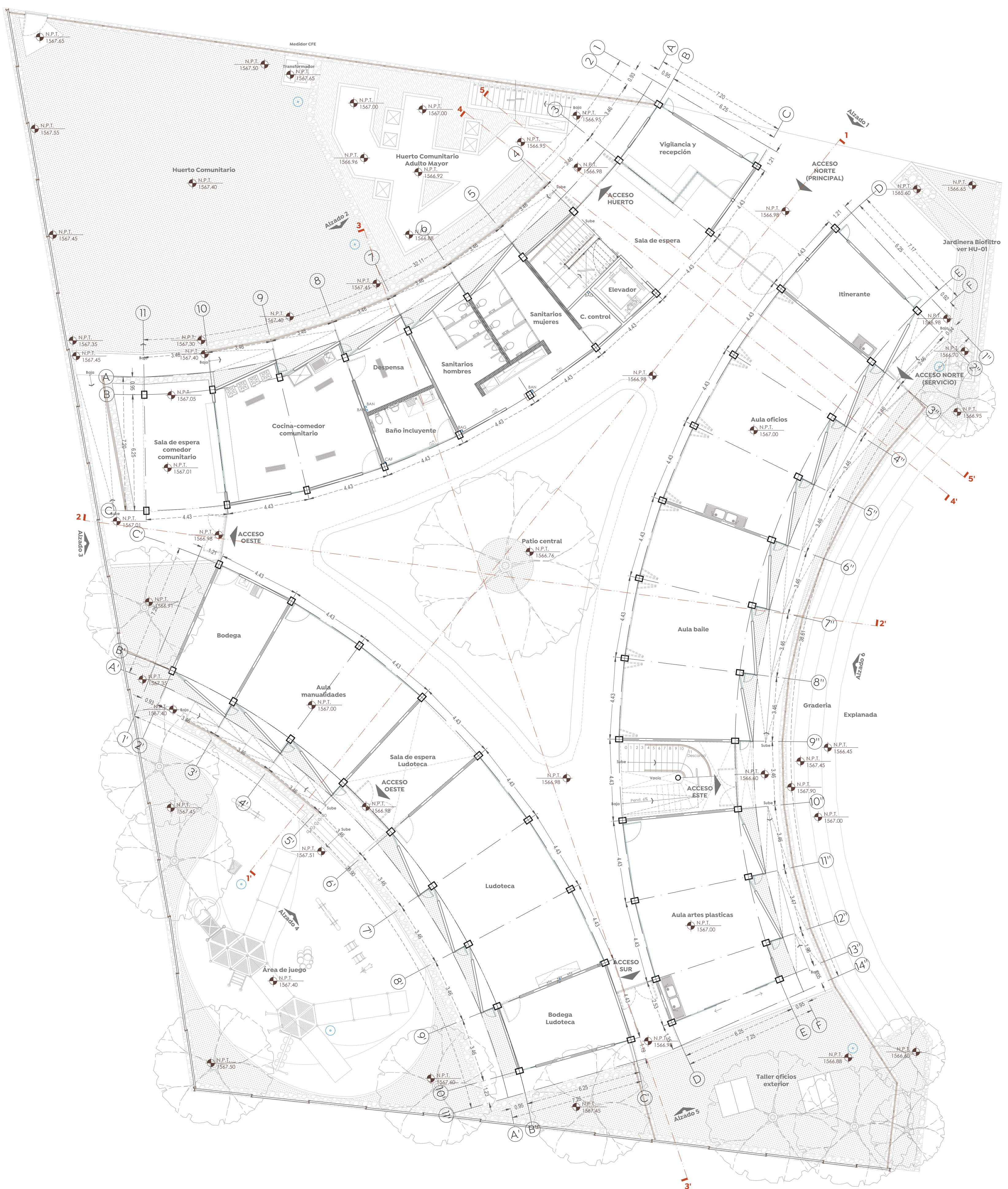
Planta Baja Colmena valle de los molinos Esc. 1:125