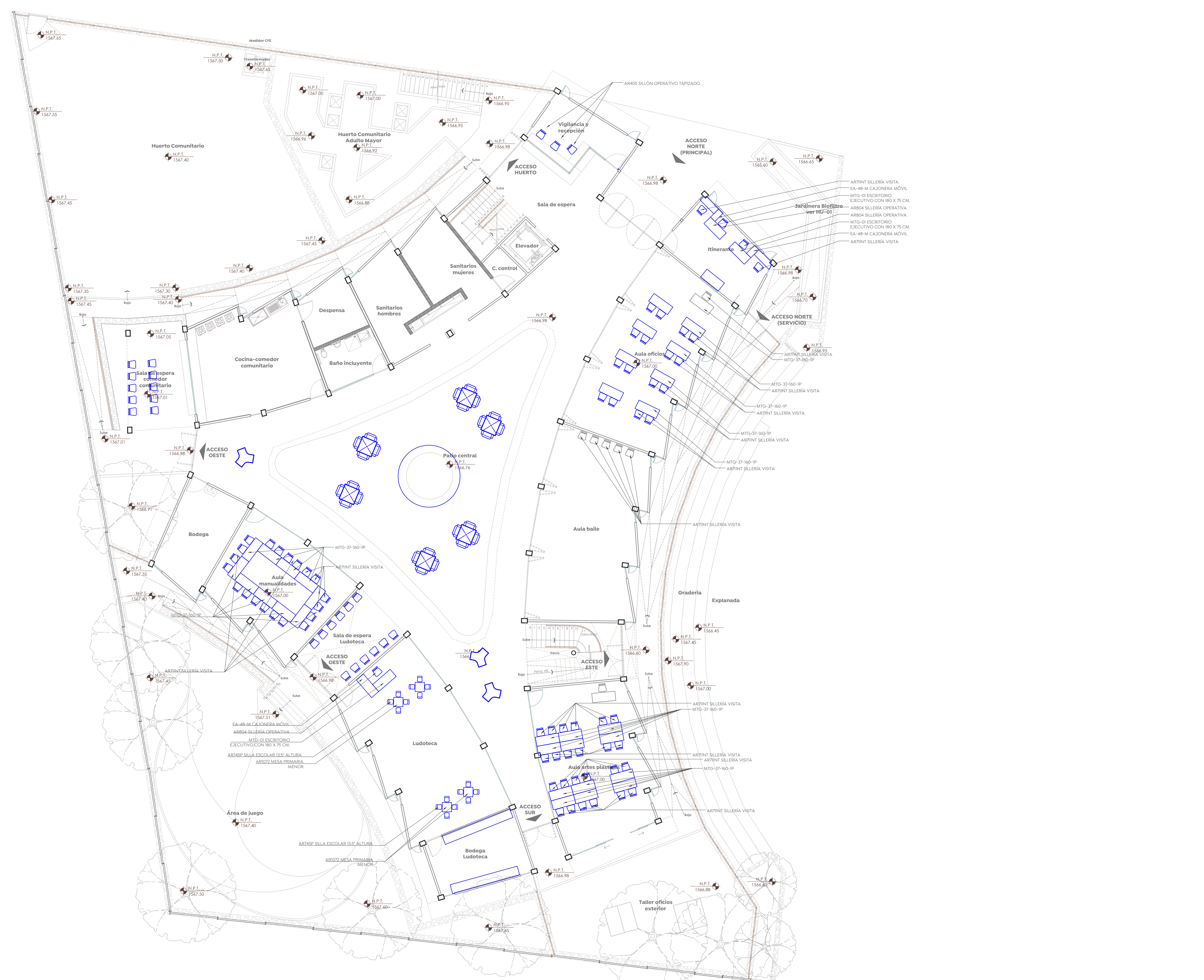
Planta Baja Colmena valle de los molinos Esc. 1:125