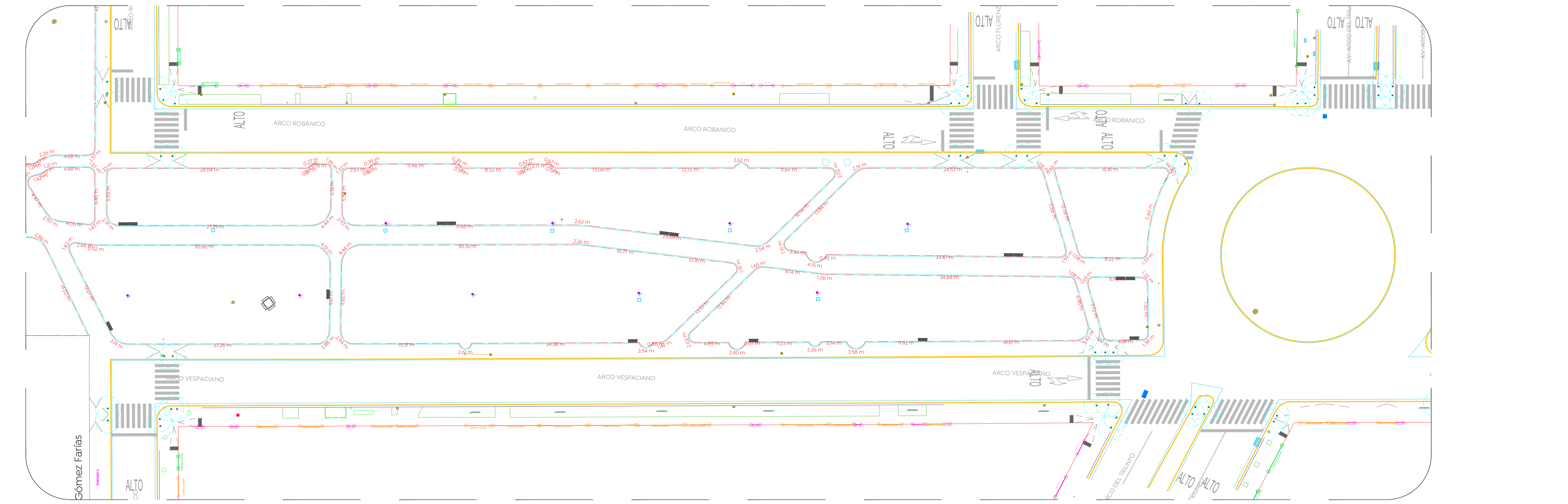
02 Planta tramo 1 Trazo 1:300