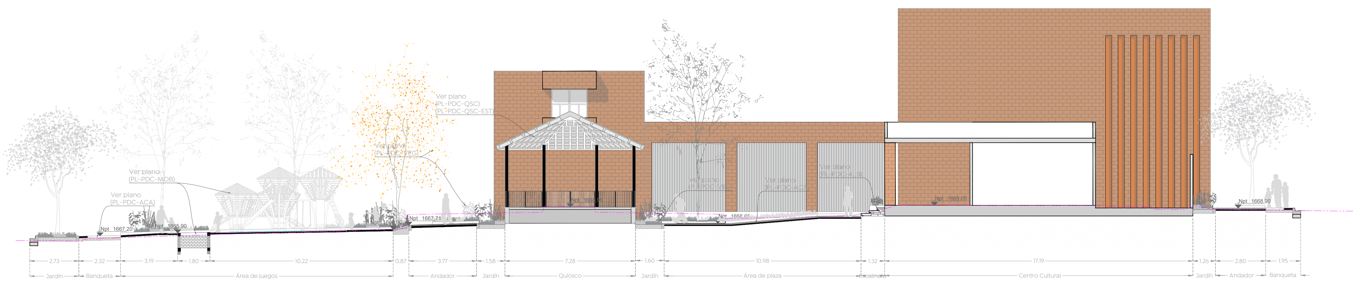
01 Sección A-A" Albañilerías 1:125

Simbología: Línea de nivel de estado actual