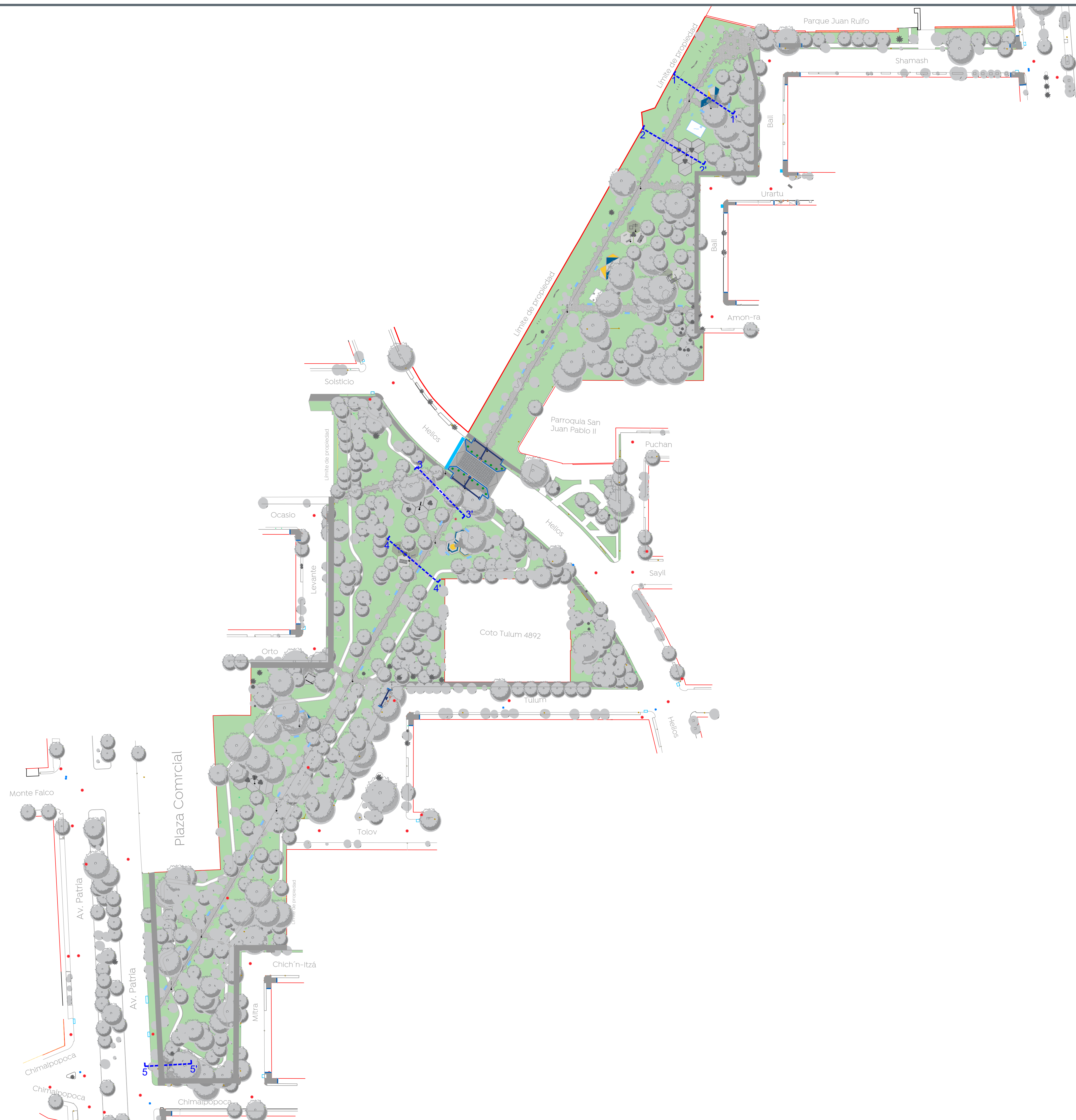
01 Planta de Conjunto Plano de albañilerías 1:750