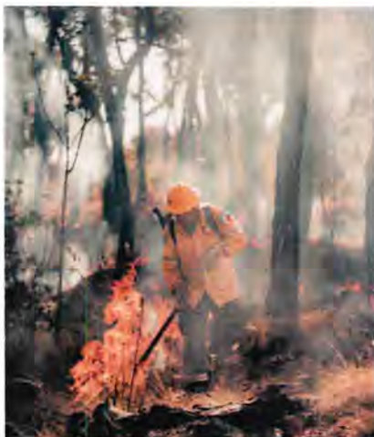
(2024). High-resolution image of a fire in a forest. https://www.alamy.com/stock-photo-123456789.html