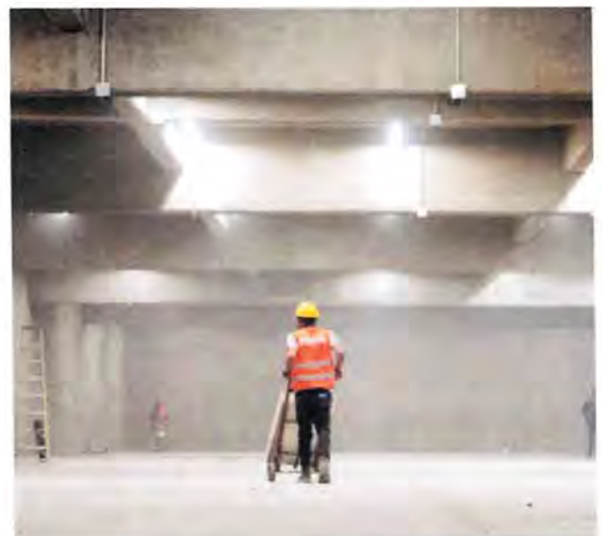
La inversión en mejorar y modernizar los espacios de práctica permite que Zapopan cuente con más y mejores elementos de seguridad.