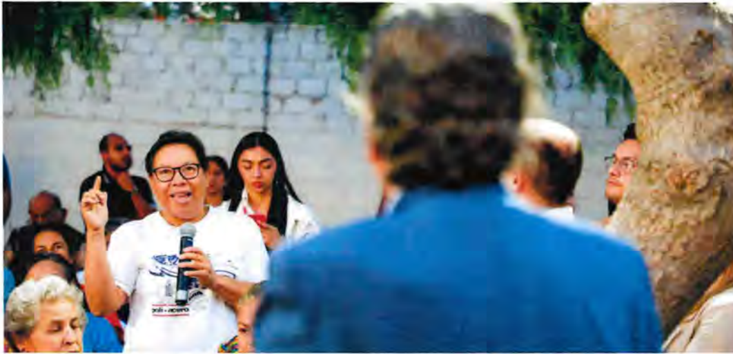
Mil nueve personas fueron capacitadas en Escuelas para Jóvenes Ciudadanas, como uno de los programas implementados para la prevención de la violencia.

El intercambio y la comunicación entre la ciudadanía favorecen la solución pacífica de conflictos. En este sentido, a través del programa Mediación Comunitaria, 382 trescientos ochenta y dos mujeres, 332 trescientos treinta y dos hombres y 14 catorce niñas, niños y adolescentes lograron alcanzar acuerdos satisfactorios mediante la firma de convenios legales y el acompañamiento de asesoría jurídica especializada.