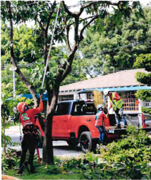
En el último año, los trabajos de mantenimiento de parques beneficiaron a más de 149 mil personas de 27 colonias.

En servicios públicos e imagen urbana, los programas de saneamiento y mantenimiento beneficiaron a más de un millón cien mil habitantes en más de 1200 colonias, con intervenciones adicionales 274 colonias que impactaron a casi un millón de personas. En prevención de riesgos, se retiraron más de 3600 metros cuadrados de residuos de canales y arroyos.