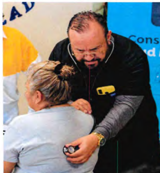
En este año de trabajo se brindó una atención integral a miembros de seguridad y sus familias en situaciones de enfermedad, defunción e insolvencia de trámites.

En Zapopan, el compromiso con la dignidad humana se materializa a través de acciones como el fortalecimiento del Grupo de Búsqueda, un escuadrón especializado en la localización inmediata de personas desaparecidas,