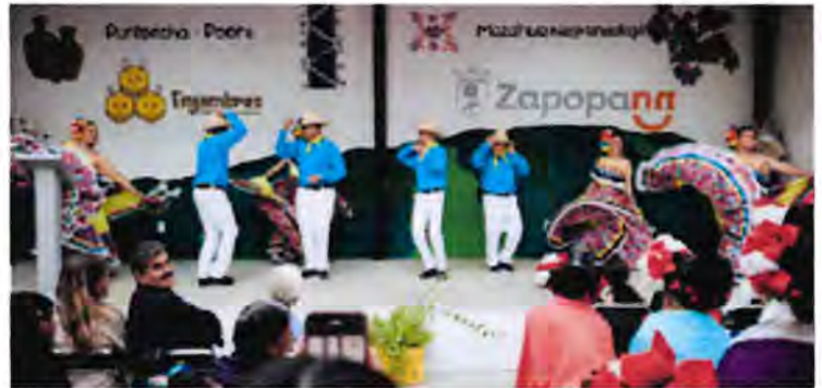
Cada mes, la red de Enjambres beneficia alrededor de mil 818 personas de 32 colonias de Zapopan.

La promoción del deporte se consolidó como un eje estratégico para la reconstrucción del tejido social y el fortalecimiento de la convivencia comunitaria. En este contexto, las Colmenas y Enjambres se posicionaron como espacios clave para el acceso equitativo a actividades deportivas. El Torneo de Fútbol Intercolmenas Zapopan reunió a 2 mil 400 participantes, principalmente niñas, niños y adolescentes, promoviendo valores como el trabajo en equipo, el respeto y la sana convivencia. De manera complementaria, el programa Espacios Deportivos registró la participación de 12 mil 090 personas en diversas colonias, mientras que la Vía RecreActiva, con 31 kilómetros de extensión, impactó a 73 colonias y contó con un promedio de 60 mil usuarios por jornada.