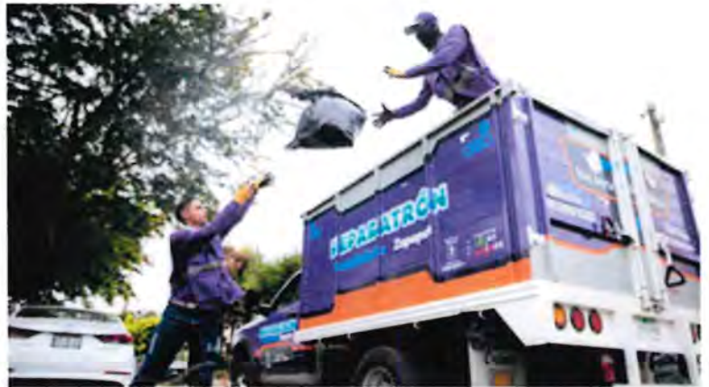
Con Reparatrón, en el último año se recolectaron 19,877,721 m 3 de desechos sólidos en Zapopan.

Finalmente, el ordenamiento del comercio en espacios abiertos benefició a más de 5 mil comerciantes registrados, se realizaron 184 y se atendió a más de 20 mil comerciantes en tianguis y espacios públicos.