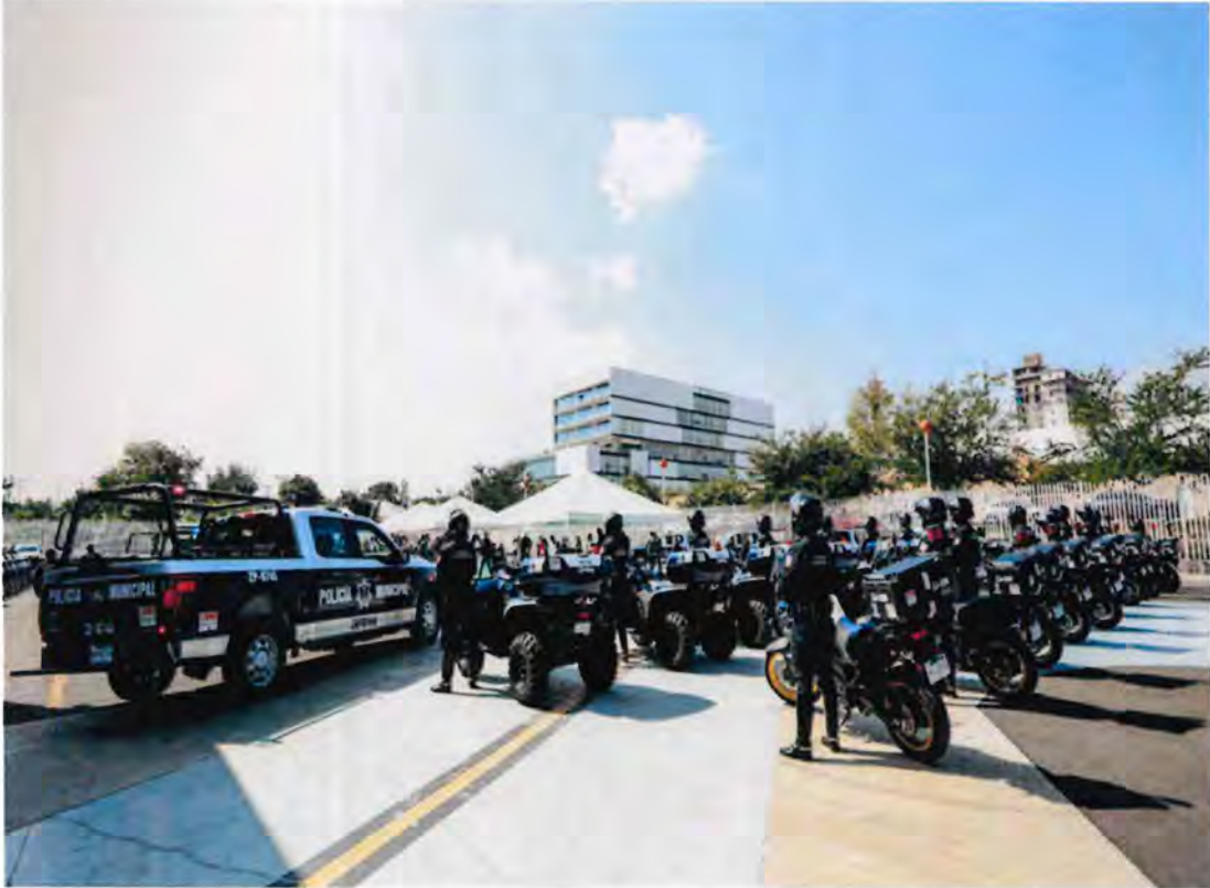
Se destinaron más de 2 millones y medio de pesos en equipos de comunicación GPS para patrullas y motocicletas.

Asimismo, como parte del proceso de modernización, destaca el Sistema Móvil de Captura Policial (SIC-POL), una herramienta tecnológica que permite integrar y analizar información en tiempo real sobre patrullajes, reportes ciudadanos, incidencia delictiva y desempeño operativo, facilitando una toma de decisiones más eficiente y transparente.