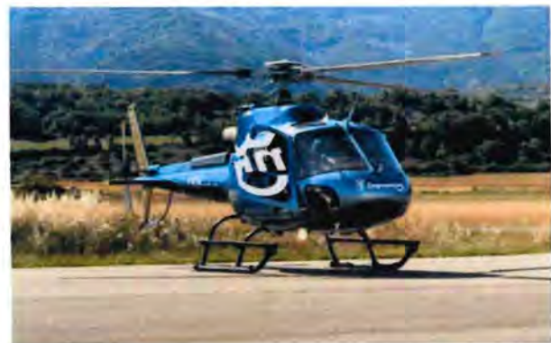
En este año, de Dubái, se envió al Escuadrón Aéreo base Zapopan personal y la adquisición de un helicóptero para mejoramiento de la atención.