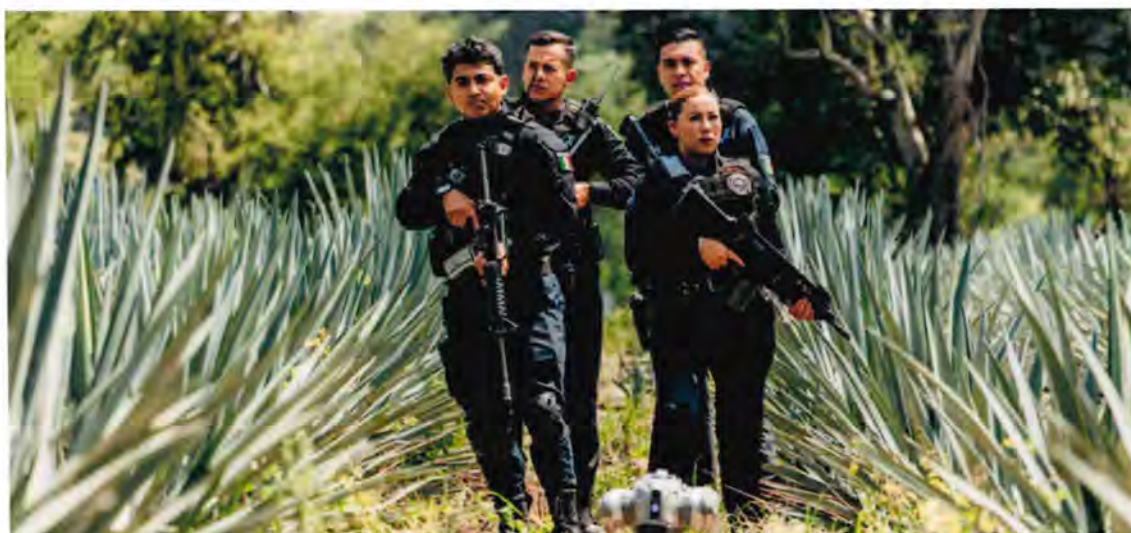
El Grupo de Búsqueda Agrocívica (GABA) personal reportadas como desaparecidas y atender 634 reportes.

De manera complementaria, la Unidad Canina se ha consolidado como un referente en la atención de emergencias, la prevención de riesgos y la promoción del bienestar animal, particularmente en entornos escolares y comunitarios. A través del programa de Fortalecimiento de la Cercanía Ciudadana y Renovación de la Unidad Canina, se integraron nuevos ejemplares seleccionados por sus aptitudes físicas y sociales, se fortaleció su plan integral de salud y se amplió la cobertura de capacitaciones en escuelas del Área Metropolitana de Guadalajara. Estas acciones refuerzan un modelo de seguridad humana que incorpora la prevención, la empatía y el respeto hacia los animales como parte fundamental de la protección del municipio.