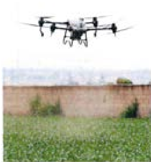
23. Un dron agrícola de la Secretaría de Agricultura, Ganadería, Desarrollo Rural, Pesca y Alimentación (SAGARPA) sobrevuela un campo de cultivo en Jalisco.

beneficiarios, y Compensación a la Ocupación, que brindó ingresos temporales a 389 personas. En comercio exterior, Zapopan Exporta respaldó a 23 micro y pequeñas empresas, principalmente de alimentos, bebidas, calzado y tecnología.