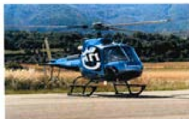
El nuevo avión de combate se incorporó al Escuadrón Aéreo Zapopan para mejorar la atención policial y la seguridad de un territorio con un alto porcentaje de zonas peligrosas.