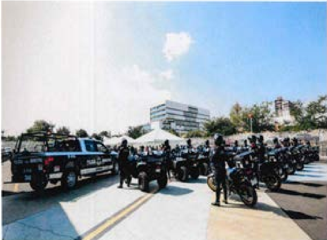
Se fortalecieron unidades y medios de transporte estables de comunicación (PCT) para patrullaje y monitoreo.

Asimismo, como parte del proceso de modernización, destaca el Sistema Móvil de Captura Policial (SiC-POL), una herramienta tecnológica que permite integrar y analizar información en tiempo real sobre patrullajes, reportes ciudadanos, incidencia delictiva y desempeño operativo, facilitando una toma de decisiones más eficiente y transparente.