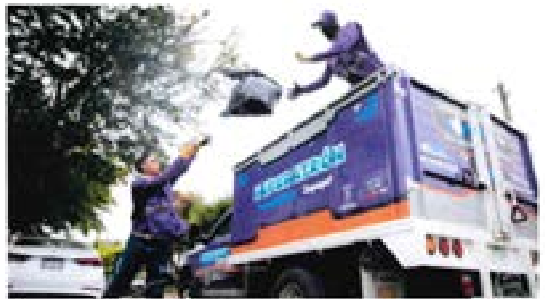
Con Regenera, en el último año se recolectaron 16,817,721 kg de desechos sólidos en Zapopan.

Finalmente, el ordenamiento del comercio en espacios abiertos benefició a más de 5 mil comerciantes registrados, se realizaron 184 y se atendió a más de 30 mil comerciantes en tianguis y espacios públicos.