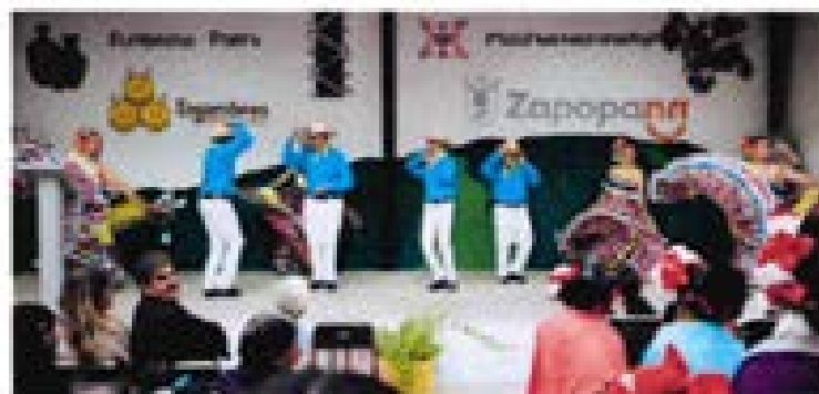
Cada mes, la red de Enjambres beneficia alrededor de mil 800 personas de 27 colonias de Zapopan.

La promoción del deporte se consolidó como un eje estratégico para la reconstrucción del tejido social y el fortalecimiento de la convivencia comunitaria. En este contexto, las Colmenas y Enjambres se posicionaron como espacios clave para el acceso equitativo a actividades deportivas. El Torneo de Fútbol Intercolmenas Zapopan reunió a 2 mil 400 participantes, principalmente niñas, niños y adolescentes, promoviendo valores como el trabajo en equipo, el respeto y la sana convivencia. De manera complementaria, el programa Espacios Deportivos registró la participación de 12 mil 090 personas en diversas colonias, mientras que la Vía RecreActiva, con 31 kilómetros de extensión, impactó a 73 colonias y contó con un promedio de 60 mil usuarios por jornada.