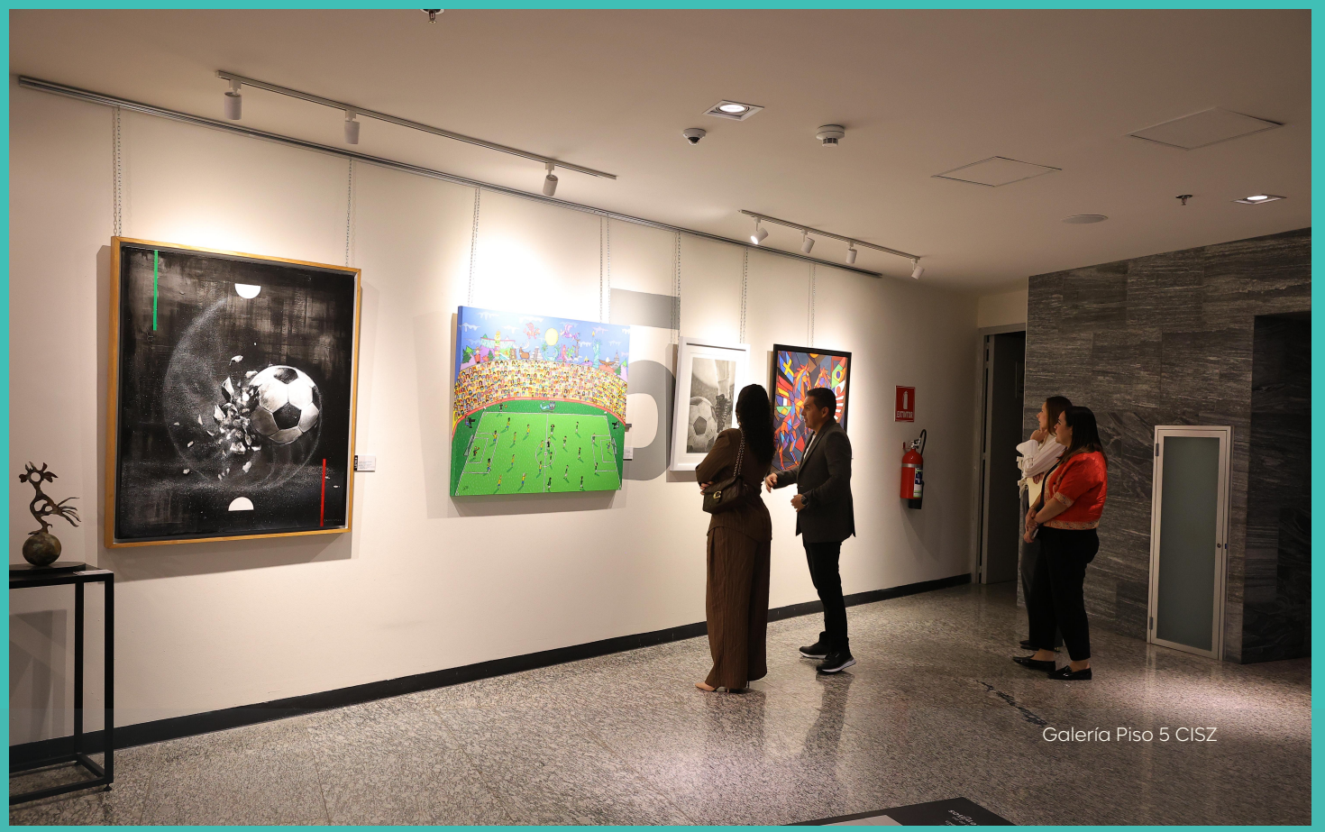
Galería Piso 5 CISZ

MANUAL DE ORGANIZACIÓN DE LA COORDINACIÓN GENERAL DE GESTIÓN INTEGRAL DE LA CIUDAD.