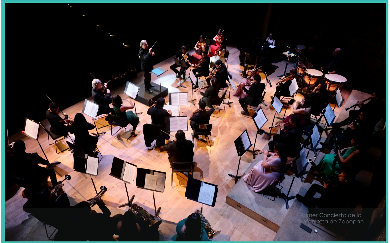
Primer Concierto de la Sinfonietta de Zapopan

MANUAL DE ORGANIZACIÓN DE LA DIRECCIÓN DE ORDENAMIENTO DEL TERRITORIO.